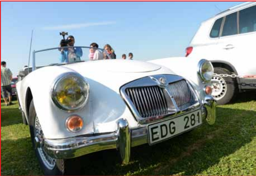
V Vodice je prišel iz daljne Švedske.