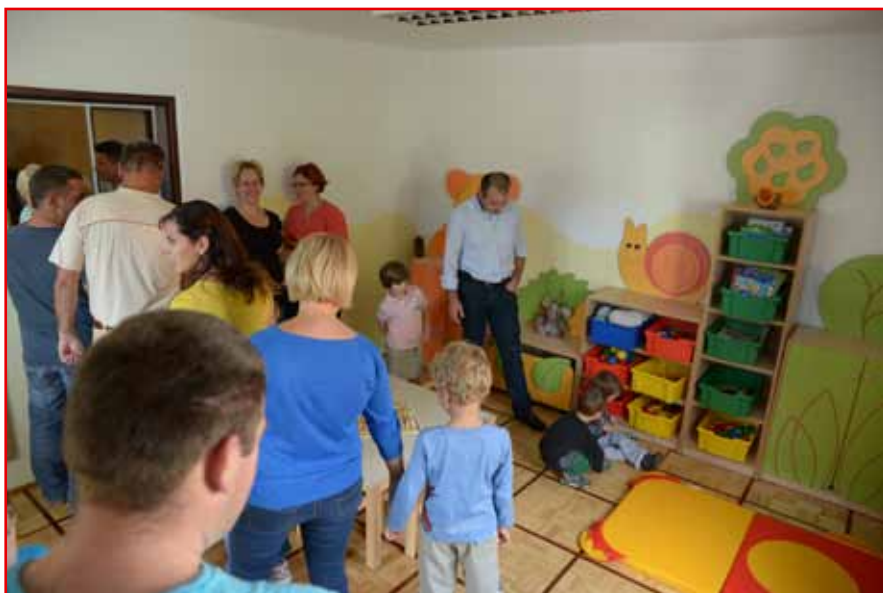
Prostor za »Čebelice«

»Ko sem izvedela, da se bo odprla nova enota vrtca, sem bila navdušena, saj sem si vedno želela delati v manjši enoti, ki ima tudi svoje prednosti. Prvi dan je potekal zelo prijetno, otroci so bili sproščeni in veseli. Veselimo se, da imamo tako blizu naravo in bomo z malčki lahko uživali na svežem zraku in sprehodih.«