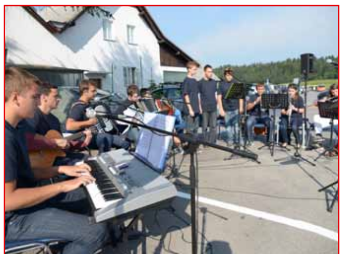
Matici so poskrbeli za prijetno vzdušje