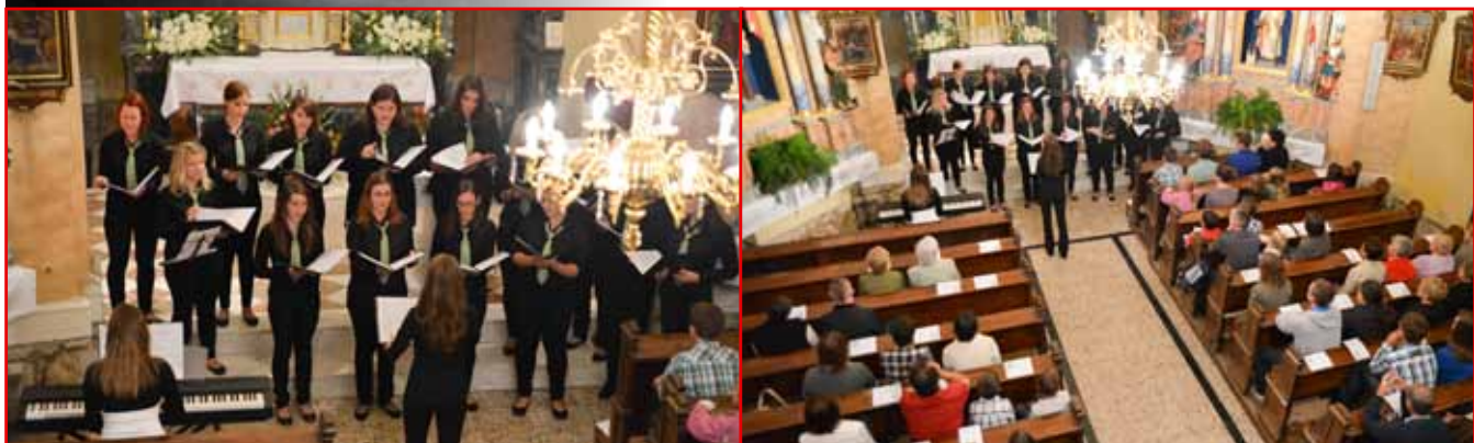
Dekliška vokalna skupina FLORA in otroški zborček Šinkov Turn enkrat na mesec s svojimi glasovi razveselujeta farane v Šinkovem Turnu.