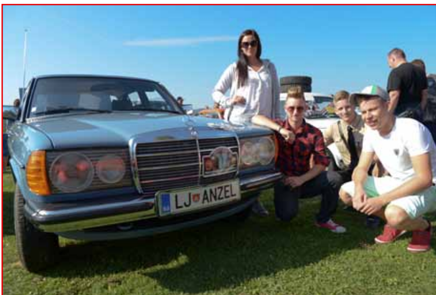
Anzel-mladina pri avtu Družinska dediščina, ki gre iz roda v rod, iz leta 1980.

Od starta v Polju ob 10. uri zjutraj pa do ponovnega zaključka v Polju ob 16. uri popoldne so prevozili zelo dolgo traso. Zapeljali so se vse do Most, Cerkelj, Preddvora, Kokrice, Šenčurja, Trboj, Valburge in nazaj.