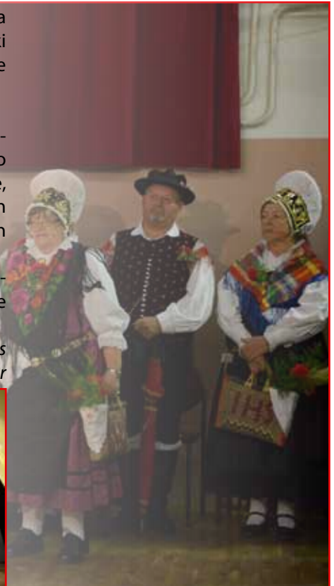
Nepogrešljive Narodne noše