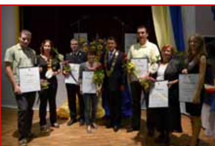
Letošnji prejemniki priznanj in plaket