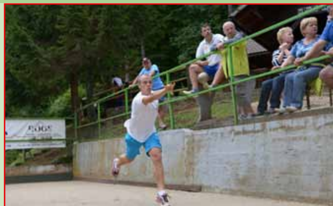
Mladi v "akciji"