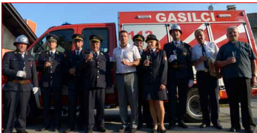
Srečno in varno uporabo novega orodnega vozila