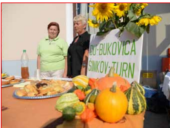
Za pogostitev je poskrbela Društvo upokojencev Bukovica - Šinkov Turn