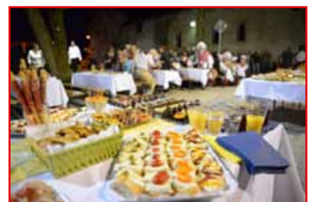
Za pogostitev so poskrbeli člani DU Vodic