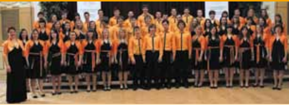
Fotografija je nastala na mednarodnem tekmovanju v Pragi, kjer je zbor prejel zlato medaljo.

Vabljeni na celovečerni koncert Mešanega pevskega zbora Stanko Premrl iz Vipavske doline, ki bo v soboto, 12. oktobra ob 19h , v dvorani Kulturnega doma Vodice.