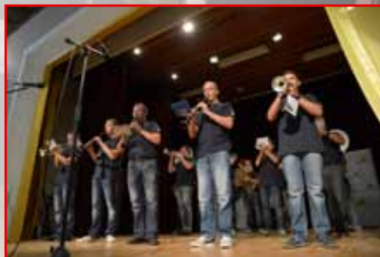
Godbeno društvo Vodice