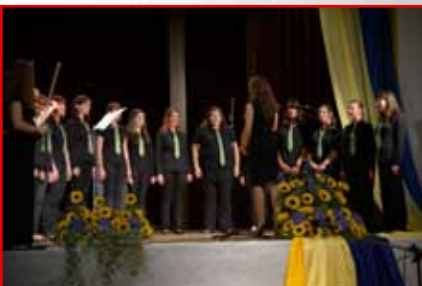
Dekliška vokalna slupina Flora