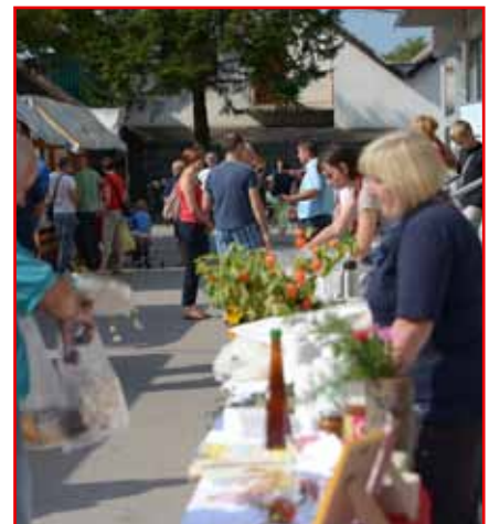
Vsak je lahko našel nekaj zase