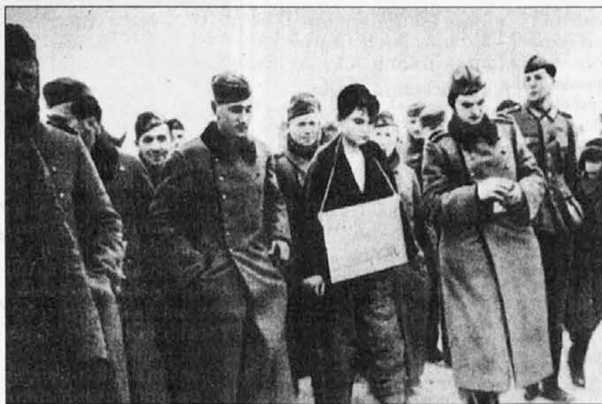
La partigiana Zoja Kosmodemjanskaja, studentessa diciassettenne di Mosca, è condotta al patibolo. (La foto fu trovata addosso ad un ufficiale tedesco caduto)