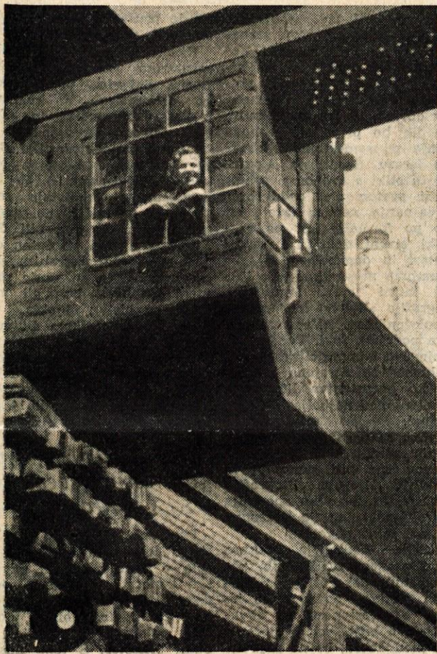
Zerjavovodka v Železarni Jesenice

spešno poslovanje podjetja, čeprav kaže zaključni račun, da predvideni dobiček ni bil zaključen. Vzrok temu je v prvi vrsti v stalnem porastu nabavnih cen surovin in pa v plani-