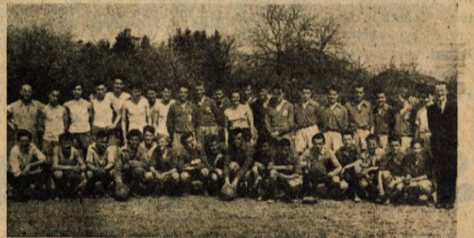
SPORTNI PRIJATELJI Nogometne enajstorice Trgovinske in Vajenske šole iz Kranja ter Vajenske šole iz Cerklje

V soboto in nedeljo so imeli atleti Odreda v Ljubljani klub-