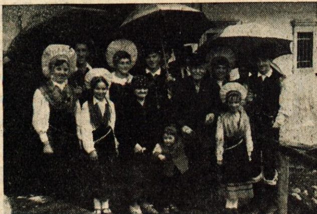
Jubilarita med svati

ja mlada življenja za svobodo. Oba, oče in mati, sta bila v času težkih preizkušenj naših ljudi odločno na strani parti-