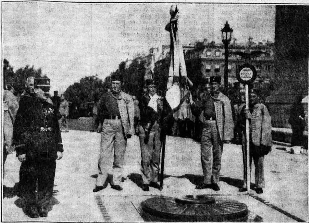
Jugoslovenski Sokoli sa saveznom zastavom nad grobom Neznanog junaka u Parizu