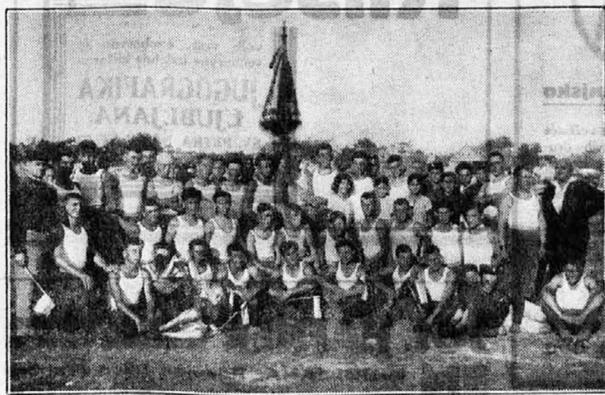
Grupa vežbača Sokolskog društva Crvenka

Od kolikog je značaja ovaj prvi polet naših mladih Sokola, znače se tek onda, kad se uzme u obzir činjenica, da je društvo osnovano tek meseca maja 1930. g. Na severnoj gra-