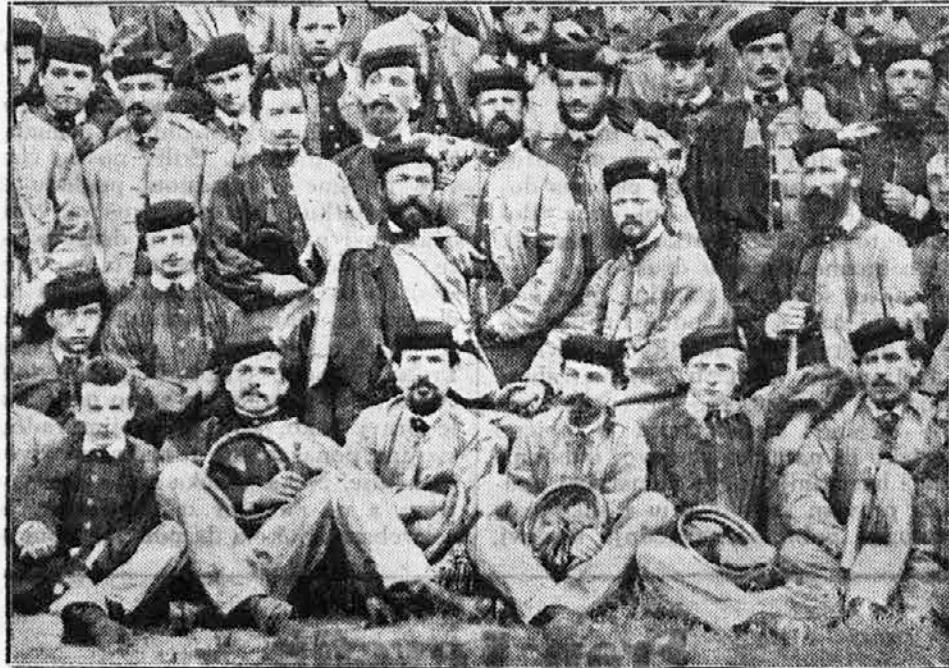
Članovi Južnog Sokola god. 1865.

O stogodišnjici rođenja svog brata, Sokola Frana Levstika, jugoslovensko Sokolstvo klanja se njegovoj svetloj uspomeni!