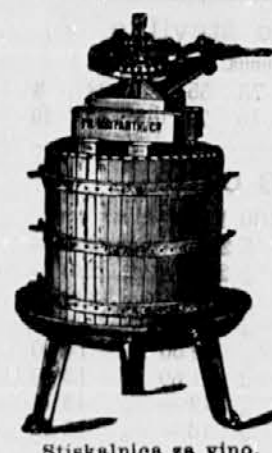
Stiskalnica za vino.

in za MASLINE so stiskalnice „ERCOLE“ najnovejšega in izvrstnega sestava s pristojem za dvostruki in trajni pritisk; z jamčena največja izraba, večja od vseh drugih stiskalnic; najbolje avtomatične škropilnice za trte patent.