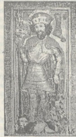
Poznejši Domicijanov nagrobnik, postavljen okoli 1450.