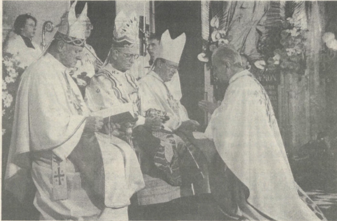
Škofovsko posvečenje novega ljubljanskega nadškofa dr. Franca Rodeta

Prezvzišeni dr. Rode si je izbral za svoje škofovsko geslo Trubarjevo učenost: "Stati inu obstati!"