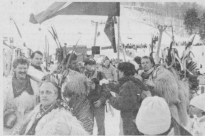
Naši kužuharji so na prizorišču svetovnega prvenstva v Vailu pritegnili veliko pozornosti.