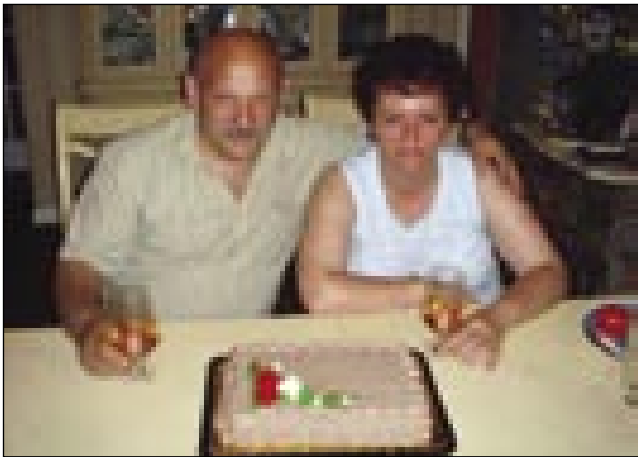
V Meriki pri možovom brati sva svetila 25. oblejtnico poroke

Petdesetšesoga leta je sploj dosta lüstva vöodišlo v Meriko, šteri so tü njali stariše, brate, sestre pa vse spoznanice. Dugo lejt so samo oni ojdli domau, dapa par lejt nazaj se je tau že malo spremenilo.