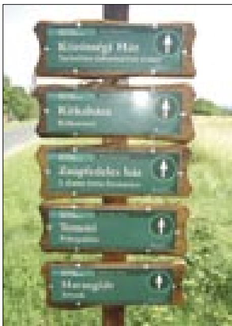
Skrb so meli na tau, naj vse bau vönapisano vogrski pa slovenski tö

»V programi mam ešče edno učno paut (tanösvény) tü na Verici z imenom Travniške orhideje. Ta učna paut se začne na Verici z edno dvojezič-