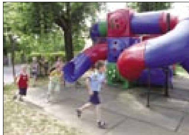
Kljub vročini so se veliko tudi igrali

Holec, so stanovali v soboškem dijaškem domu, večina aktivnosti pa je potekala v bližnjem vrtcu Miške. Geslo jubilejnega tabora je bilo Od zgodbe do igre . S pomočjo krajsih zgodb in ob izdelovanju slikanic ter metuljev so se mladi Porabci učili materinščine; bili so tudi