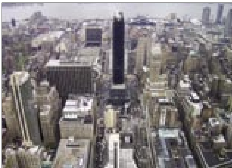
New York s ptičje perspektive

»Sama nej, če bi cejla družina z menov ušla, te ja. Ovak nej.«