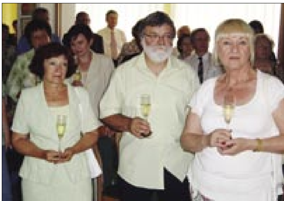
Sprejma ob slovenskem državnem prazniku so se udeležili predstavniki občin ter družbenik in civilnih organizacij z obeh strani meje

Slovenija si je postavila visoke standarde, ki naj uravnavajo njeno življenje. Rečeno je bilo, da kot soustvarjalci evrop-