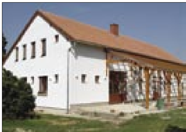
Obnovljeni kulturni daum de prejkdani 19. augustuša

no informacijsko tablov z zemljevidom pa dé cejlak do Ritkarovec, od tistec pa nazaj pridemo ta, od kec smo štartali. Med potjauv si sedem