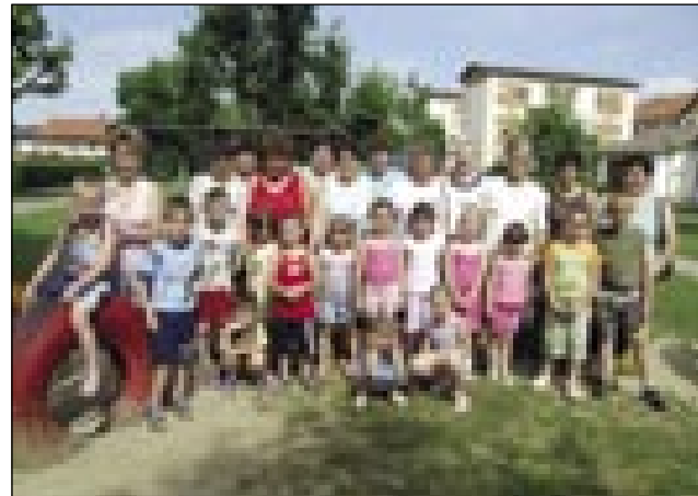
Malčki, mamice, babice in vzgojiteljice