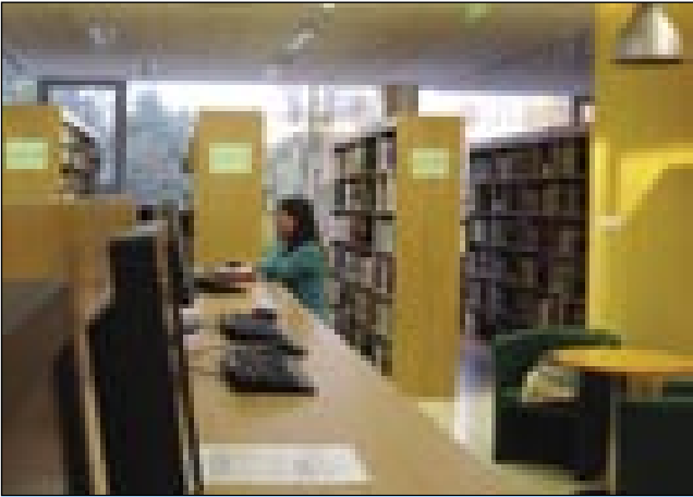
Lani so predali Univerzitetno knjižnico v Sombotelu