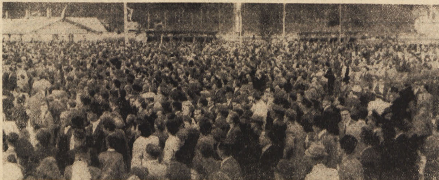
Nepregledne množice iz vse Slovenije so se udeležile velike proslave desete obletnice ustanovitve I. koroškega partizanskega bataljona