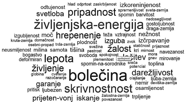
Slika 2: Deskriptorsko polje 5 kodiranih pokrajinskih prvin.