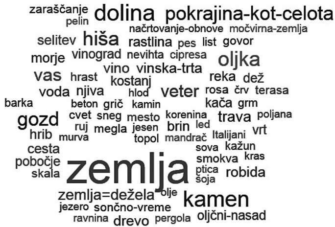
Slika 3: Deskriptorsko polje kodiranih kognitivnih in emocionalnih prvin.

Trde istrske so skale, so stoletjem kljubovale: tudi mi! (Kocjančič, Šavrinske 6)