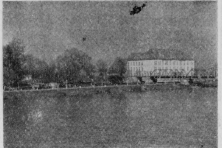
Pri »Mladiki« bo zbor za povorko 22. t. m.