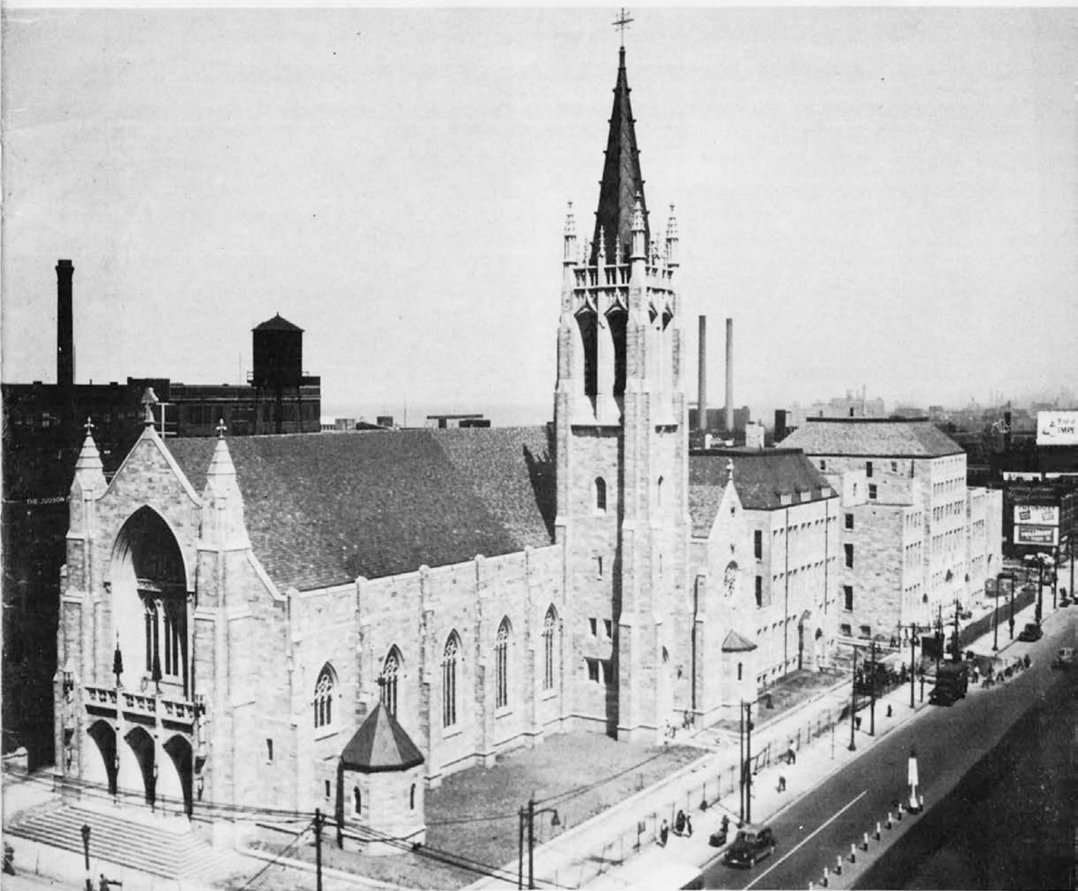
St. John's Cathedral, Cleveland, Ohio.