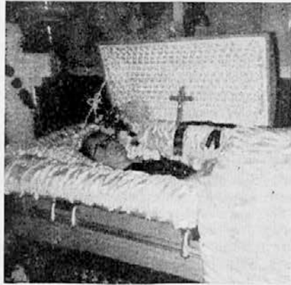
† JOSEPHINE BENKŠE na mrtvaškem odru