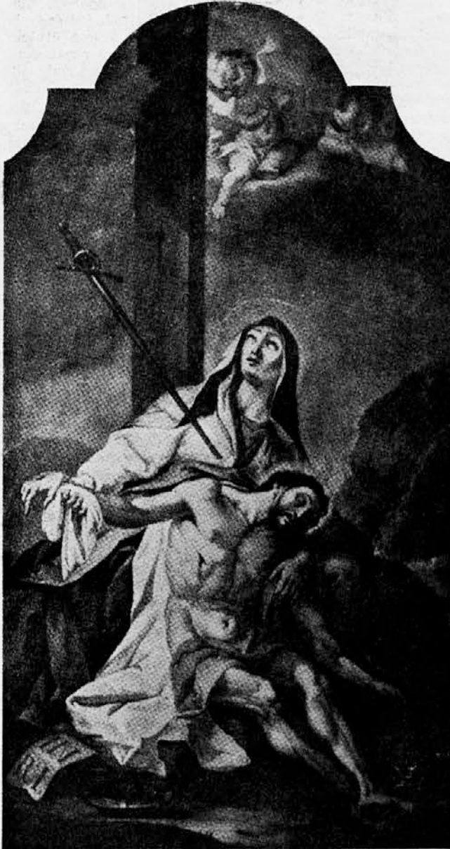
The Sorrowful Mother holds Her dead Son. (Bergant)

As a small child, Bergant watched his carpenter father as well as local artists decorate newly constructed