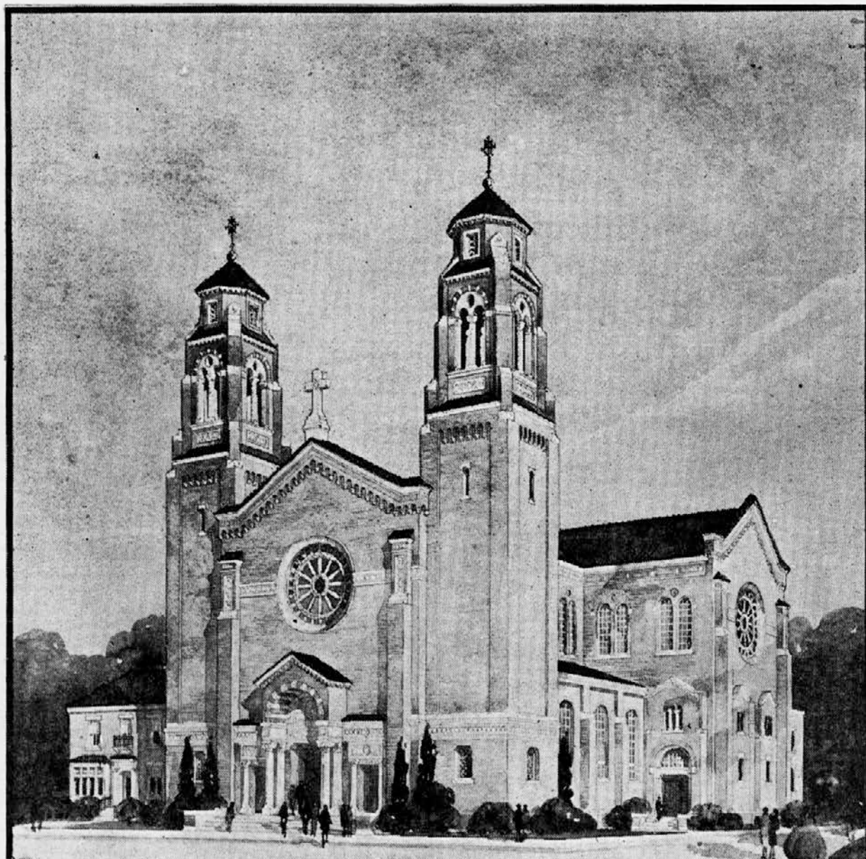
CERKEV SV. VIDA V CLEVELANDU, OHIO.