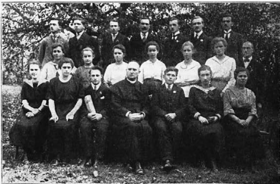
Pevski zbor na Ježici pri Ljubljani.