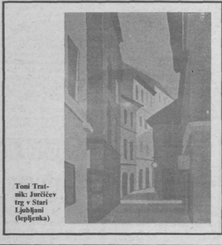
Toni Tratnik: Jurčičev trg v Stari Ljubljani (lepljenka)