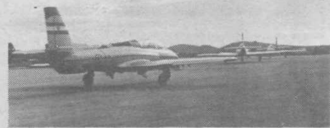
Pred vzletom. Tudi naši mladi Močani so že samostojni piloti v letalih oziroma gojenci v letalskih šolah