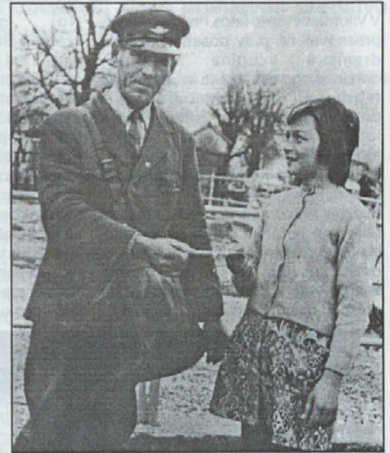
Fotografija iz 1960 leta

V času Kraljevine Jugoslavije se je pošta imenovala Sveti Bolfenk v Slovenskih goricah. Za vsako hišo je imel točno po vrsti zloženo pošto v torbi, v potovnik jo je zložil že na pošti. Vsaka hiša je imela svoj predal, torej 300 označenih predalčkov. Pošto je vedno raznašal po istem