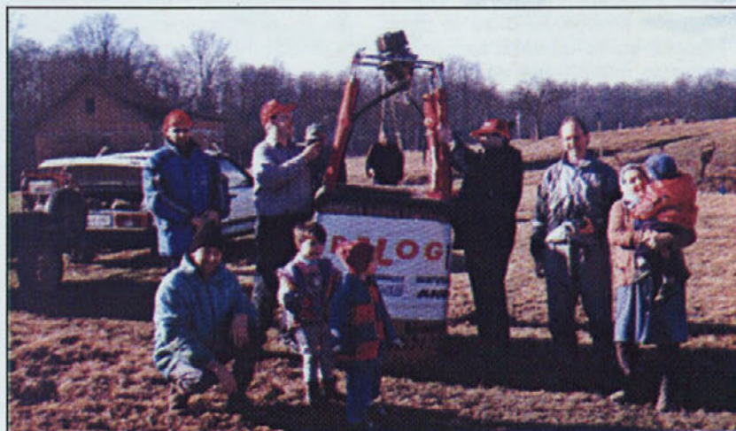
Ob pospravljanju balona še gasilski posnetek