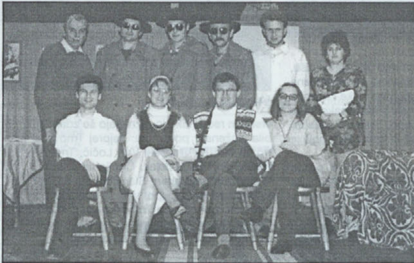
Štirje letni časi, Vinko Möderndorfer, 1998