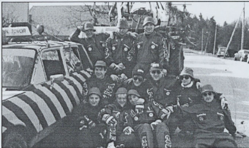
Člani pustne AMZ Trnovska vas pred odhodom na ptujski pustni karneval.