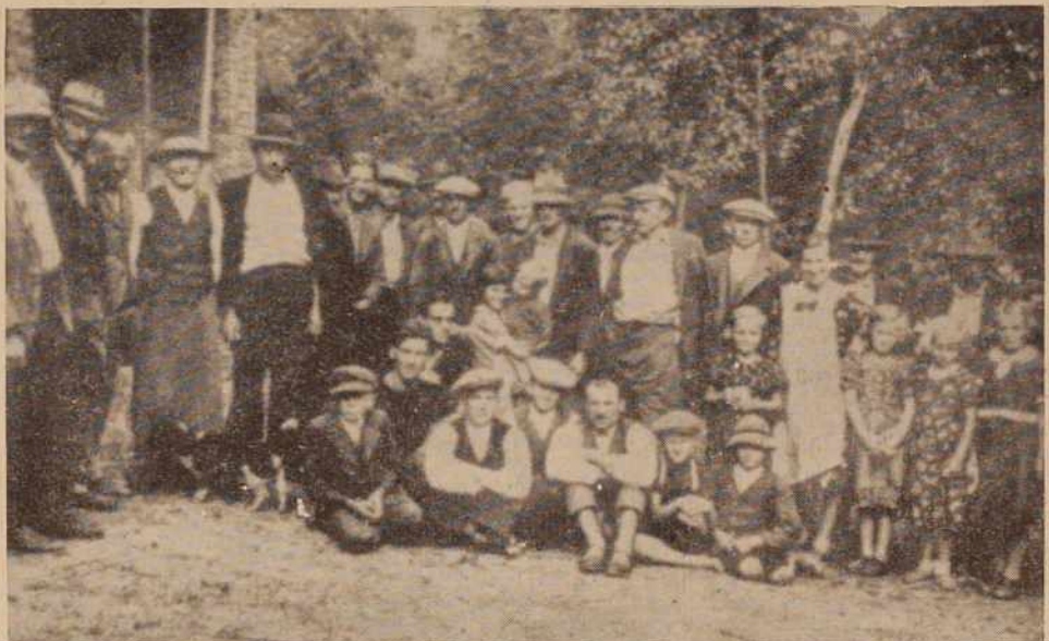
S tabora v Adrijancih avgusta 1939. leta

Poleg tega je komite razpravljal tudi o vključevanju ciganske mladine v redno zaposlitev in še o nekaterih drugih problemih.