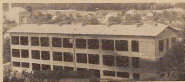
Sola v Gornjih Petrovcih

sklep šalovske kmetijske zadruge, da bodo v garažah v Hodošu uredili hlev za 40 glav živine, a prihodnje leto da bodo gradili hlev še za 100 glav živine. Enako nameravajo graditi hlev za 100 glav živine tudi pri kmetijskih združenjih Krizevci. To pomeni, da se to področje v celoti usmerja v pitanje živine in v sadjarstvo. Dohodki od tod so vsekakor boljši kot pa dohodki od poljedelstva, ki nima pogojev v hribovitih krajih.