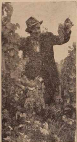
Lani so se na Vinskih vrhovih ponašali s takimi grozdi

Vinogradi so začeli v zadnjih sončnih dneh hitro zoreti. Njihovo zorenje je močno oviralo neugodno vreme v prejšnjih mesecih. Nekatere vinograde je bilo potrebno škropiti proti raznim boleznim tudi po petkrat. Vse to je nekoliko zmanjšalo pridelok, ki bo v primerjavi z lanskim nekoliko nižji. Če bosta september in oktober sončna, bo kvaliteta precej dobra, vendar pa ne bo dosegla lamske. Letos je ravnina dobro obrodila. Nekatera posestva so jo dale na trg, nekaj pa so je že potrgali za stiskanje. Ranito so začele močno napadati ose, zato jo bodo skoraj povsod potrgali nekoliko predčas-