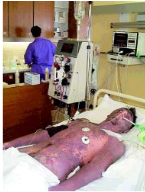
Sl. 2. Za fulminantno meningokokno septikemijo so značilna obsežna purpura, visoka vročina, šok in znaki diseminirane intravaskularne koagulacije.

Fig. 1. With shock, severe peripheral vasoconstriction with cyanotic extremities become evident. If the patient survives amputation of fingers or limbs is necessary.