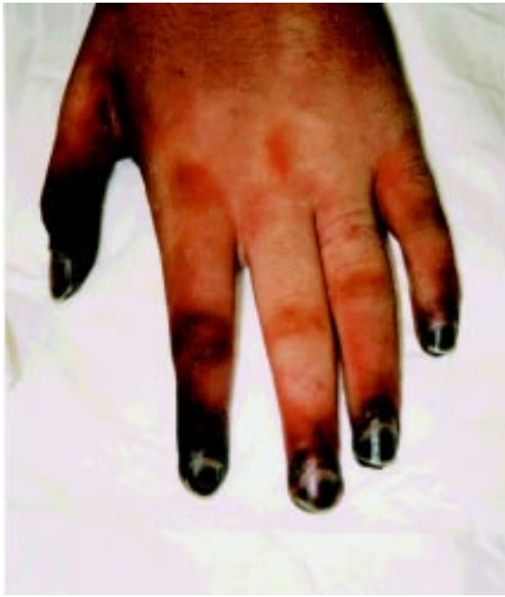
Sl. 1. Izrazita periferna vazokonstrikcija s cianotičnimi udi pri bolniku v šokovnem stanju. Če bolnik preživi, so potrebne amputacije udov ali prstov.

Fig. 1. With shock, severe peripheral vasoconstriction with cyanotic extremities become evident. If the patient survives amputation of fingers or limbs is necessary.