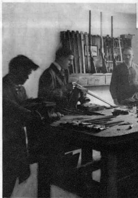
Pogled v delavnico baskilerskega oddelka