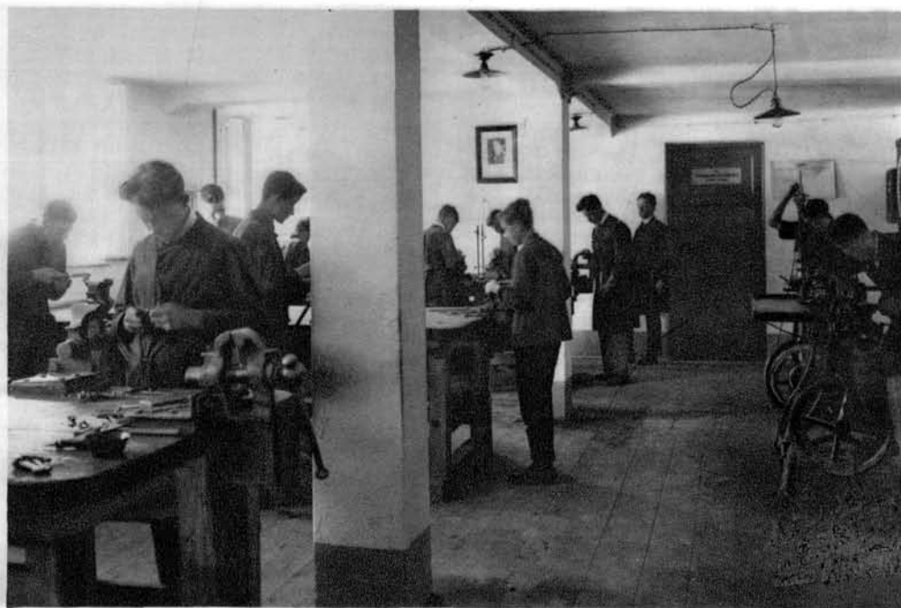
Pogled v delavnico sprožilarskega in celinarskega oddelka

Učni načrt je urejen po zgledu borovljske šole. Vsakega gojenca v glavnem usposobi za samostojnega puškarja. Ker pa moderna puškarska tehnika ne priznava stališča, da bi en delavec izdeloval cel svoj izdelek sam, ampak temelji na principu deljenja dela, se poleg splošne