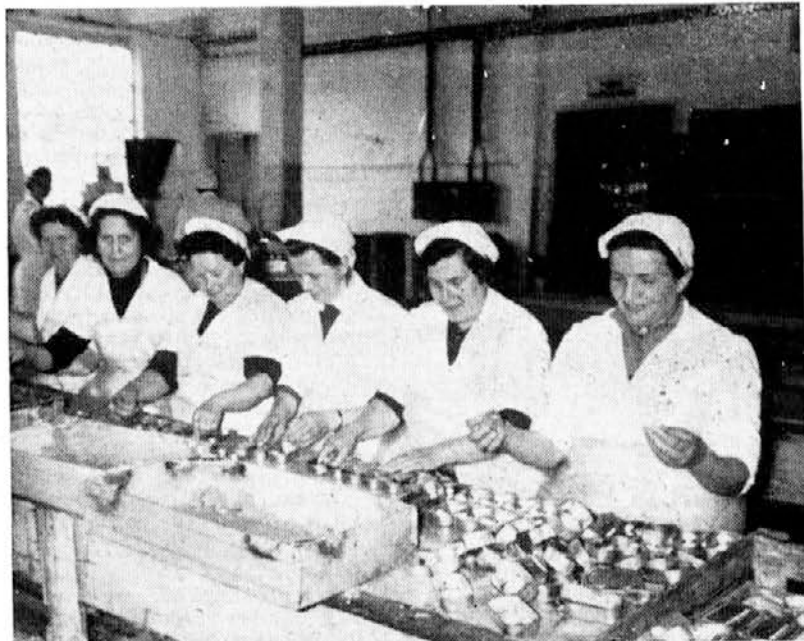
Zadnji dnevi na oddelku predjedi pred preselitvijo

Z našim nazivom smo torej povedali, da je v dozi povrtnina in manj tunine. To je pošteno! Če bi pa zapisali, kakor si nekdo predstavlja, da bi bilo pravilneje, Salat-Thunfisch bi bilo nepošteno, ker to bi pomenilo tunina za solato, v angleščini pa Salat-tuna celo mlada tuna, v obeh primerih pa to, da je v dozi sama tunina brez nobenega dodatka. Zato mora torej ostati — pošteno! Thunfisch na prvem mestu v sestavljeni besedi.