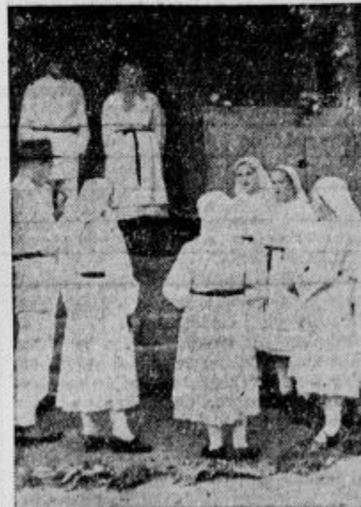
Hochzeit in Bela Krajina. — Iz belokranjskega ženitovanja.

Da se je taka nesreča zgrnila nad Belo Krajino, je mnogo krivde v tem, ker so prej pošiljali v Belo Krajino sko-