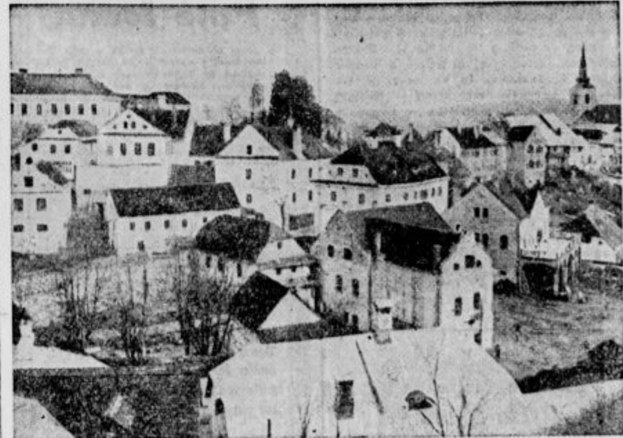
Anblick auf Metlika. — Pogled na Metliko.

Kakor hitro pa so prenehali glavni turški napadi, je v Beli Krajini nastopila že tretja nesreča. Upravičeno trdijo nekateri zgodovinarji, da je bilo sedemnajsto stoletje za Belo Krajino stoletje samih nesreč. V teh časih so se iz belokranjskih utrjenih gradov izselile brambovske posadke, ki so odšle na Hrvaško. Z vojniki je odšla tudi živahna tr-