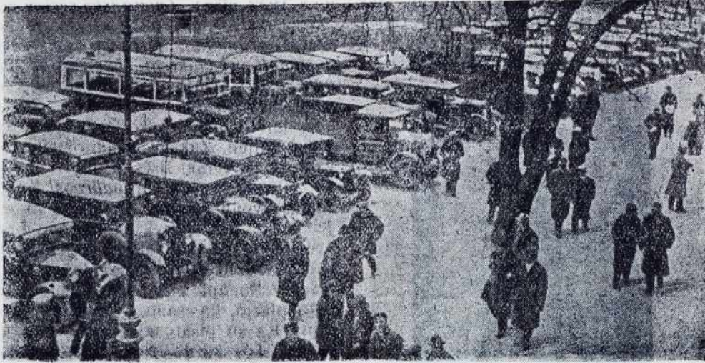
Strajk avtomobilistov v Pragi. Iz cele Češkoslovaške, ešče celo iz oddaljenih karpatskih mest so prišli osebni i tovorni avtomobili v glavno mesto Češkoslovaške republike Prago, da bi tam protestirali proti p višanji avtomobilske d. ce. Med policisti i gospodarji avtomobilov je prišlo do ostrih spopadov.

svet ne šteje čuti od spovedi, je z velikim željov oprao svojo dušo i jo okrepa z Zveličitelovim telom. Zročimo ga v molitev dobrim dušam, ka ostane v mučnom. teškem betegi stanovitven v potrplivosti i daruje svoje veliko trpljenje za sveto Cerkev. To je najlepša molitev vsakoga, posebno pa betežnika.