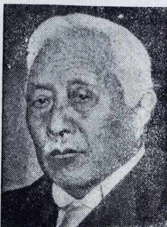
Japanski ministerski predsednik Saito.

»Književnost«, ki piše v zadnji številki, da je vera bila že dostokrat premagana i jo to tudi zdaj čaka! — Takša je vretina »Novoga časa«!