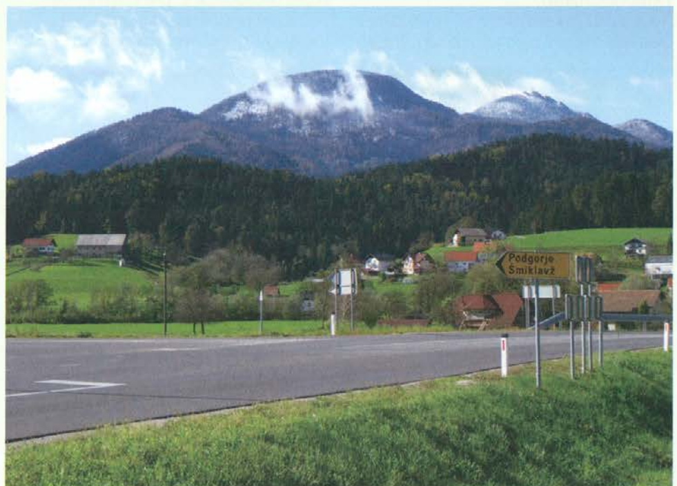
Pogled na zasneženo Uršljo goro (22. 10. 2014)