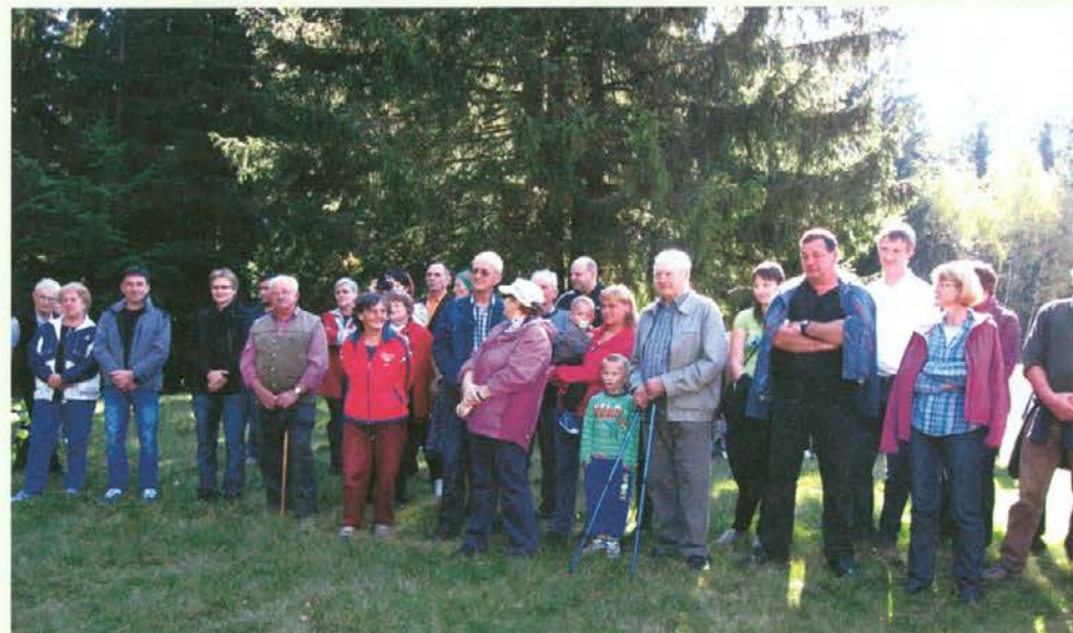
Nedelja, ko smo posadili lipo spomina na naše delo.

Lipi so namenili moč povezovanja in medsebojnega razumevanja ljudi. Jernejčani so preživeli hude, hujše čase kot marsikje. Izropani že v času kraljevske krize, izžeti v prvi in drugi vojni, šikanirani v obdobju zadržnega socializma in obveznih oddaj. Po so znali preživeti z medsebojno pomočjo; je sosed posodil ali dal hleb kruha, pa četudi ga je svojim otrokom rezal tanke šnite . Tudi tem zgledom solidarne strpnosti je posvečena lipo.