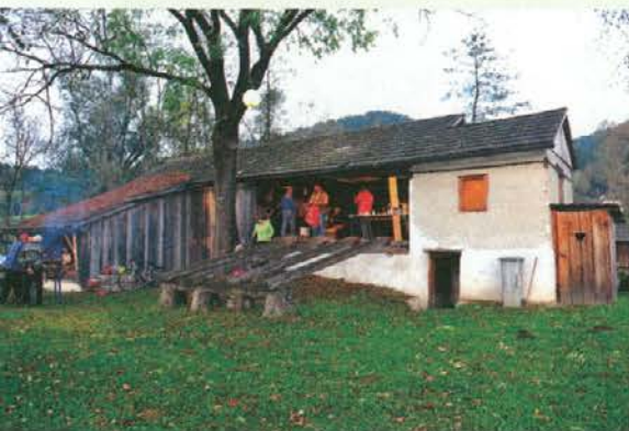
Žaga nam je nudila streho.

Lepo družinsko doživetje z novimi znanji in spretnostmi v čudovitem okolju in na svežem zraku smo vsi skupaj zapustili z lepimi občutki. Ohranjanje in predajanje starih znanj in veščin je pomembno in veseli smo, da so nam pri izvedbi z veseljem priskočili na pomoč v društvu Vedrin, ki tudi samo dela na tem. Naslednje leto pridite na kožuhanje tudi vi.