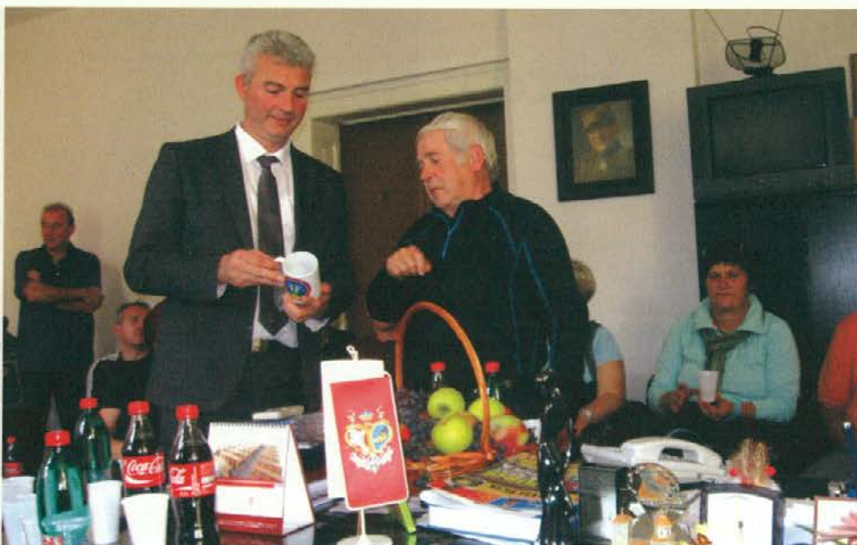
Sprejem pri županu občine Topola

Prvi dan našega obska smo namenili medsebojnemu druženju in obisku uvodnega dela turistične prireditve Berba v Topoli. V času te prireditve, ki traja nekaj dni, se na prireditvenem odru zvrstijo številne kulturno-umetniške skupine, po ulicah Topole pa razstavljavci na stojnicah ponujajo najrazličnejše vrste blaga. Na ulicah je pestra ponudba srbske hrane in pijače, v gostinskih lokalih in na prostem