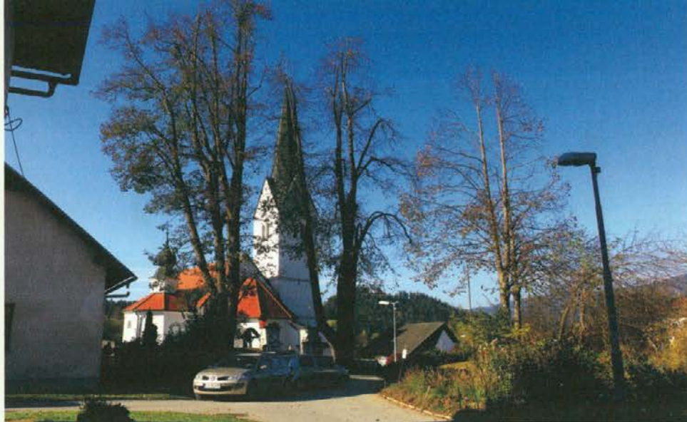
Pod lipami v Kotljah je zdaj bolj varno.

drevesa, kjer je sedaj velika luknja. Kljub vsemu so ji drevesni plezalci z obrezanjem in čiščenjem namenili še nekaj let, vsekakor pa bo prej ko slej treba razmisliti o odstranitvi drevesa in nadomestni saditvi. Dve drevesi, eno na Strojni in eno v Kotljah, sta bili precej poškodovani zaradi žleda, saj se je polomila skoraj polovica vej, nekatera drevesa pa ogroža tudi belo omelo, ki je drevesni parazit in ga je treba sproti odstranjevati. V začetni fazi ga prenašajo ptice, vendar se sčasoma začne samostojno prenašati po drevesu in okužene veje začnejo odmirati. Eno od dreves na Strojni je bilo še posebej obloženo z belim omelom, vendar ga je izvajalcem del z veliko truda uspelo vsaj začasno odstraniti. Težava pri sanaciji dreves je bila tudi neposredna bližina pokopališča, saj je bilo treba grobove pod drevesi zavarovati pred padajočimi vejami,