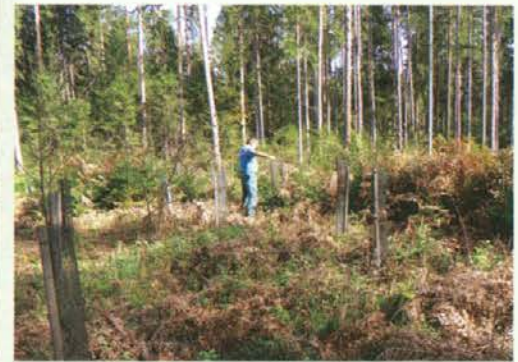
Izvršena obžetev tulcev z zaščitnimi sadikami

Slovenj Gradec – Legen, Mislinjska Dobrova).