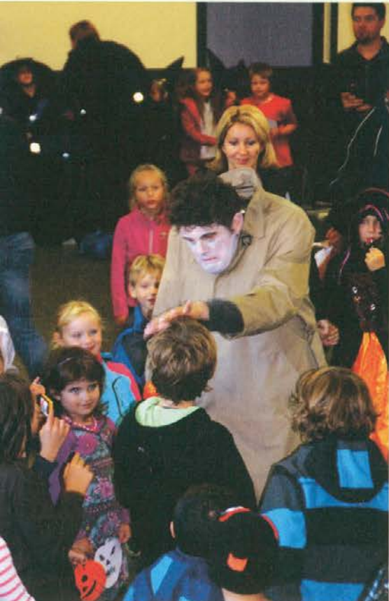
Grunf iz Teatra Cizamo

Dobro vzdušje, otroški smeh, zadovoljstvo staršev ter kriki malih in velikih čarovnic so nas grela oba dneva. Predvsem pa smo se strinjali, da mora fest postati tradicionalen. Hvala prav vsem, ki ste se zabavali z nami. Prav vaš obisk je največja nagrada za naš trud in delo. Čarovniški pozdrav iz Vuzenice vse do prihodnjega leta!