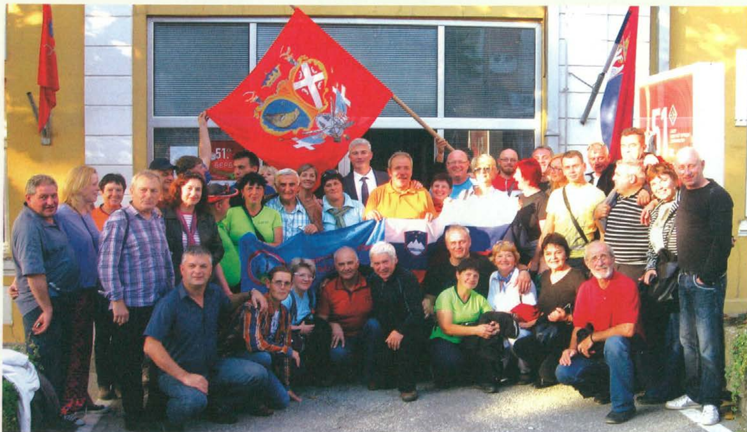
Skupinska fotografija pred mestno občino Topola

Vsekakor se moramo zahvaliti pobratimom iz Kragujevca za zares gostoljuben sprejem in prijetno druženje. Ob slovesu smo se dogovorili, da v prihodnjem letu pride k nam njihova skupina planincev. Skupaj bomo obiskali nekaj zanje še neosvojenih vrhov in pogorij v Sloveniji.