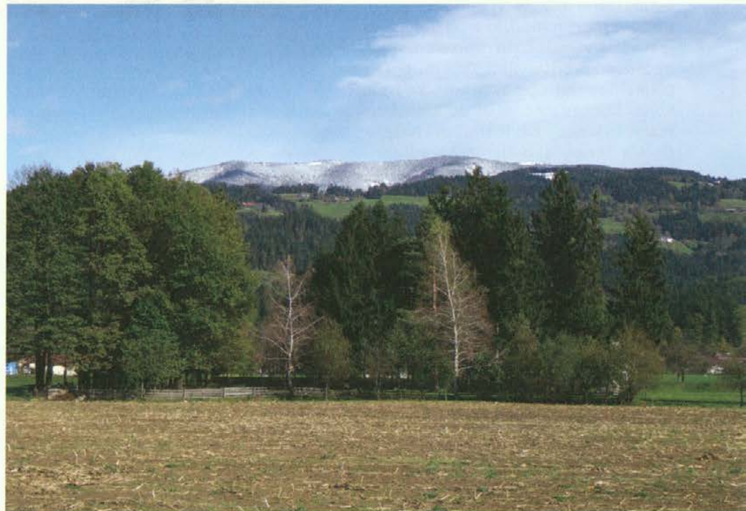
Zasneženo Pohorje z Mislinjske Dobrove (22. 10. 2014)

Sorazmerno lepo vreme je mnoge privabilo v naravo. Med njimi so bili tudi šolarji, ki so jih gozdarji v času naravoslovnega dne vodili po učnih in drugih gozdnih poteh.