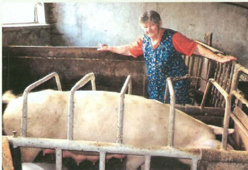
Vodovska bica nam rada pokaže svoje prašiče