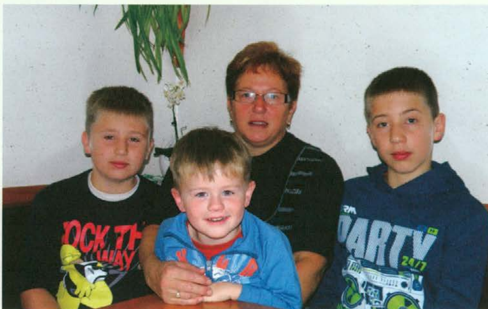
Kmetica leta s svojimi vnuki

Predvsem lahko obiskovalci poskusijo domače dobrote ter tudi domače sokove,