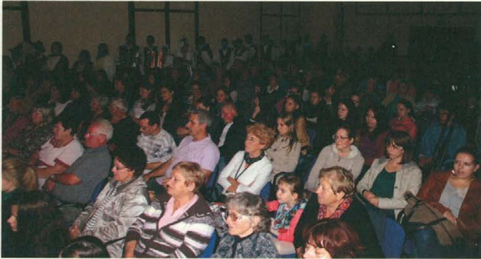
Večnamenska dvorana Vuzenica je dobesedno pokala po šivih.