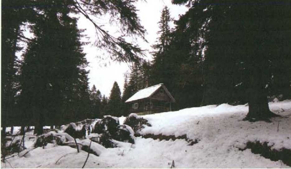
Lovska koči na Mulejevem vrhu na mislinjskem Pohorju (24. 10. 2014)