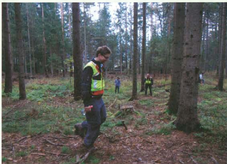
Člani GRS in skavti se pomikajo v vodoravni liniji v razdaljah 8 do 10 metrov.

Vaja je bila ocenjena s skupno oceno (od 1 do 5) zelo dobro (4). Ocena je bila posredovana poveljniku CZ občine in županu. Uporabna pa bo za eventualne dopolnitve načrtov zaščite in reševanja v občini in kot napotek za nadaljnje delo enot prostovoljnih društev, ki po pogodbi sodelujejo v Civilni zaščiti Mestne občine Slovenj Gradec.