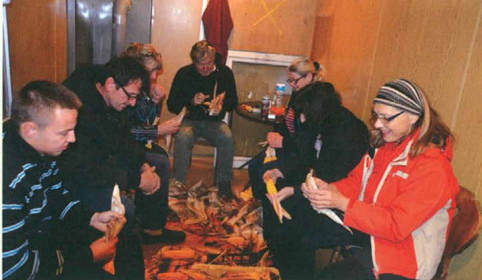
Tako nekako so zaključili take večere tudi naši predniki.

Cross Country Club Legen že vrsto let organizira prireditve, s katerimi obuja stare ljudske običaje iz okolja, v katerem deluje; med njimi spomladi Zelenega Jurija, jajčarijo, jeseni ličkanje koruze in v zimskih