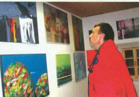
Obiskovalci so si z zanimanjem ogledali razstavljene slike.

Odprtje razstave je potekalo v obnovljenih prostorih Tisnikarjeve