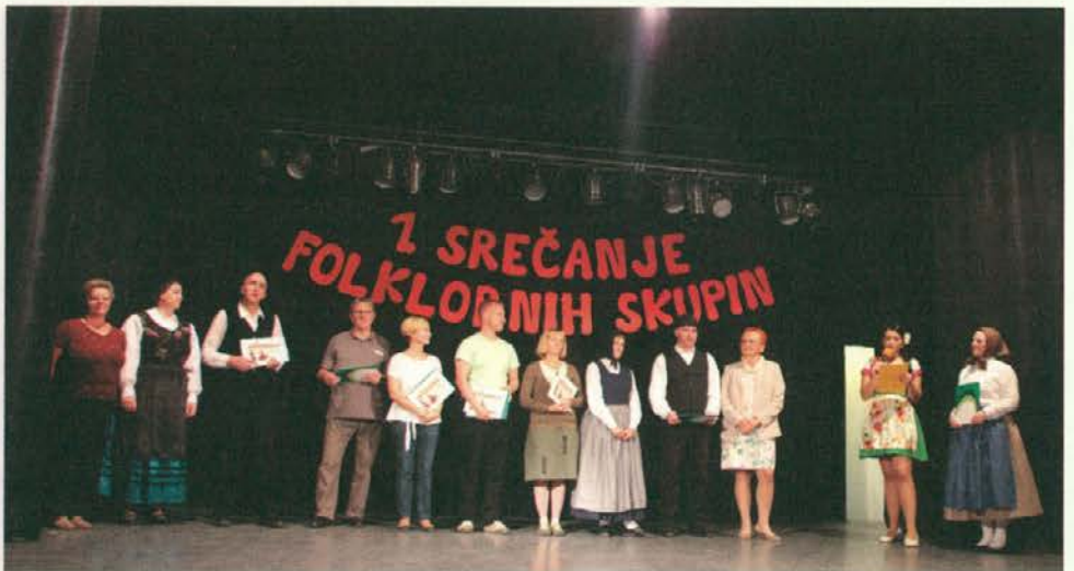
Podelitev zahval vsem mentorjem. Podelila jih je direktorica CUDV Črna na Koroškem.