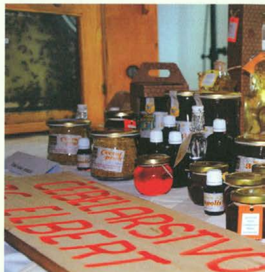
Ponudba medenih dobrot čebelarstva Elbert iz Spodnjega Razborja

Kar smo prestavili uro, so dnevi krajši. Sonce hitro zaide in jutranja megla se potegne marsikdaj preko celega dneva. Res ni drugega pametnega dela, kot da se stisnemo nekam za peč na toplo. Tudi s čebelicami je tako.