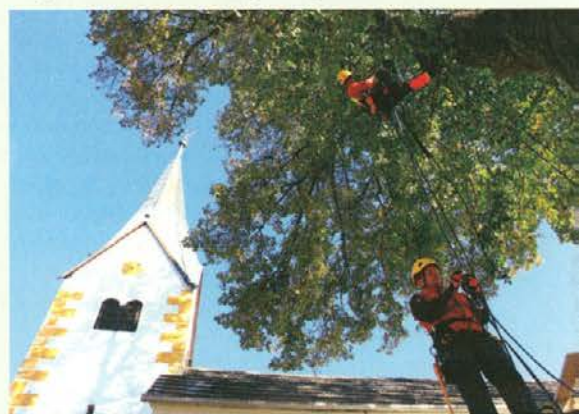
Drevesni plezalci so obrezali in sanirali lipe na Strojni.

"Obglavljanje dreves je velika težava v urbanih okoljih. Drevesa so na tak način veliko bolj izpostavljena propadanju, saj veliki rezi pomenijo večinoma večjo možnost za trohnobo. Obenem drevesa prav na oslabljenih delih nato poženejo veje, ki rastejo in se debelijo zelo hitro. Močne veje na slabi osnovi pa pomenijo nevarnost za okolico, saj so občutljive na veter, žled, sneg, skratka na vse obremenitve. Hitra rast pomeni tudi večje stroške, saj je treba drevesa obrezovati na krajše časovno obdobje. Pogosto močno