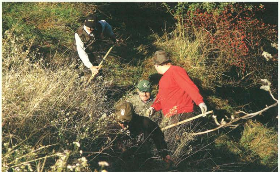
Zadnja letošnja košnja konec septembra

Ob zavedanju, da mnogo lepše površine v dolinah ostajajo neobdelane, se lahko samo vprašamo, kako dolgo še? Ali kdo od tistih, ki za drobiž prodajajo slovensko zemljo tujcem, sploh razmišlja o čem drugem, kot o lastnem dobičku in o davkih, ki ga lahko izterja od ljudi, ki še vztrajamo tam na Gori?