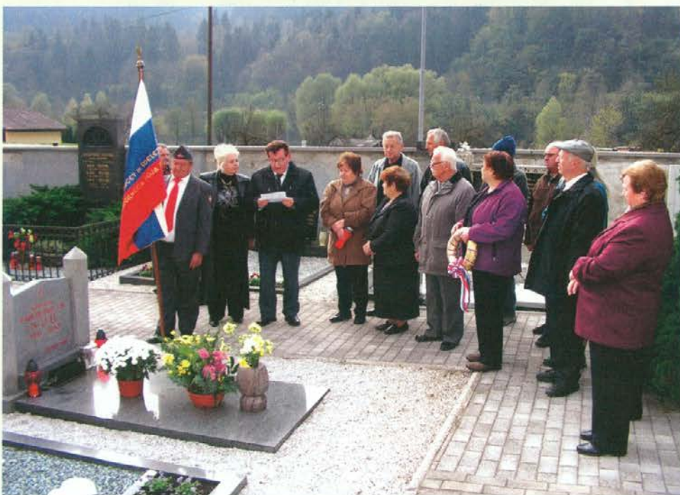
Komemoracija na pokopališču v Breznu