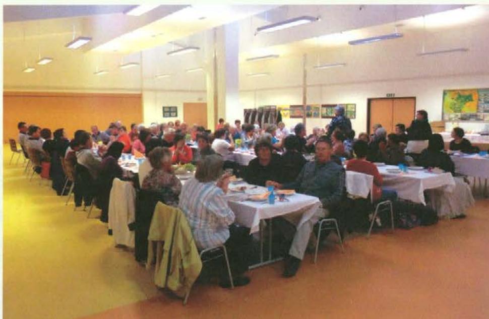
Na srečanju v Mislinji nas je bilo več kot sto.