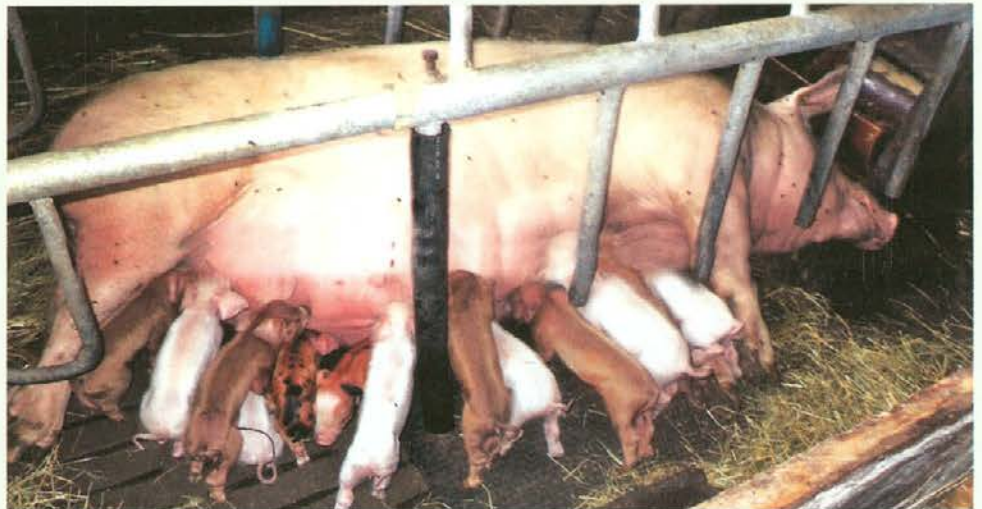
Majhna neboljena bitja, ki že bijejo bitko za preživetje, glede na to, da je premalo seskov za vse.

Še vedno jo pot vsak dan zanese v hlev, kjer krmi prašiče in skrbi za številni naraščaj; njen trud pa je ob zadovoljnem pogledu na veliko prašičjo družino zares poplačan. Še vedno se rada vrti po kuhinji, iz katere pogosto zadiši po domačih dobrotah, ki jih pripravljajo njene delovne roke, vse izpod spretnih prstov pa zna začiniti s pravo mero ljubezni. Da bi Vodovski bici zdravje še naprej tako služilo in bi nam lahko bila s svojo vitalnostjo še dolgo dober zgled!