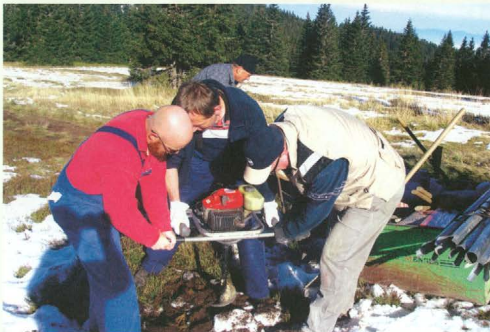
Vrtnanje lukenj v trda pohorska tla je kar težaško delo.

Vsi udeleženci te akcije si zaslužijo priznanje za opravljeno delo.