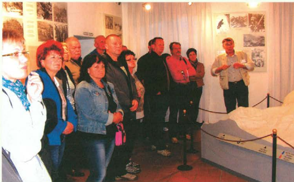
Ogled Kobariškega muzeja

Številne njegove besede so bile izrečene tudi na osrednji prireditvi 28. oktobra v Knjižnici Ksaverja Meška, kjer smo se smeli sprehoditi po Meškovi življenjski poti, ko smo številni navzoči spremljali recital ljubiteljske gledališke skupine Teharje iz Celja s pevsko navezo