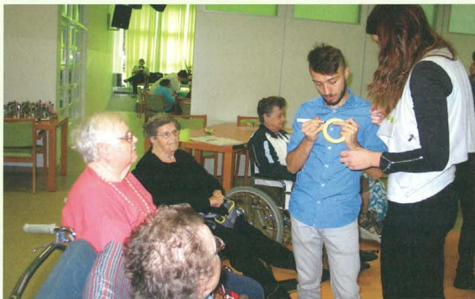
Prostovoljci z varovanci doma

Hrvaške in Slovenije, vključeni v evropski projekt Erasmus plus. Namen obiska je bilo neformalno usposabljanje mladih, ki že imajo nekaj izkušenj pri delu z ranljivimi skupinami ljudi, kot so invalidi, slepi, slabovidni, starejši, skratka ljudmi, ki zahtevajo poseben pristop. V delavnice s prostovoljci se je vključilo kar 80 stanovalcev, ki so izrazili navdušenje in dobrodošlico gostom iz tujine. Aktivnosti so prostovoljci prilagodili potrebam in željam stanovalcev.