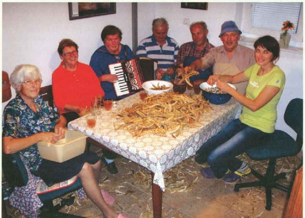
Slika nam pove vse.

Ne bi jima mogli reči, da sta novodobna vrtičkarja, saj se s to vrsto dejavnosti ukvarjata že dolga leta. Skoraj vso ozimnico Kurmanški pridelajo na svoji njivi, od krompirja do fižola ter podobnih stvari, na vrtu pa zraste vsa ostala zelenjava. Zelo dobro se zavedajo, da je domače predelana hrana najbolj zdrava. Največ pa jim pomeni, da se lahko ob dolgih jesenskih večerih družijo ob luščenju fižola in podobnih opravilih, saj si imajo veliko povedati o bogatem življenju,