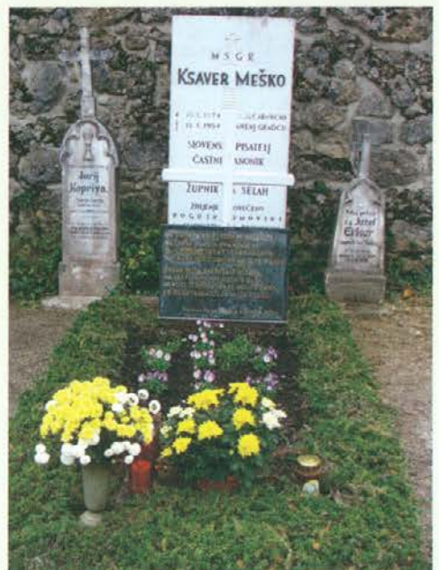
Ob Meškovem grobu, kjer se pogostokrat ustavi korak ljudi iz njegovih rodni krajev.

Posebno doživetje je bilo v Ošteriji Žogica, ki je v neposredni bližini tega mostu. Tu je osebje gostilne v uniformah vojakov iz prve svetovne vojne in bolničark uprizorilo bojno akcijo v spomin na 100-letnico začetka prve svetovne vojne, udeležencem ekskurzije pa so