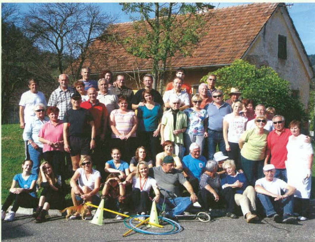
Krajani zaselka Ob Suhodolnici

Krajani zaselka Ob Suhodolnici so se letos že šestnajstič zbrali na tradicionalnem srečanju sokrajanov. Dobijo se na križišču ob samem vstopu v tako imenovano "šoder jamo". To ime izhaja še iz časov, ko so tu ven vozili prodni pesek za ceste po vsej Koroški. Danes pa se tu ponaša prelep zaselek s štiridesetimi hišami. Ti sosodje pa se srečujejo tudi ob raznih drugih priložnostih, kot so postavljanje mlaja ob prvem maju in krašenje božičnega drevesca ter podobno. Lepa sobota jim je postregla s prelepim, toplim vremenom, tako da je bilo vzdušje prečudovito. Da pa ob srečanju obogatijo svoje druženje, se pomerijo v raznih športnih in šaljivih igrah. Ob predobri hrani in zlahkni kapljici pa čas kar prehitro mine. Za zaključek srečanja je letos poskrbel "pek", ki je spekel nekaj meric slastnega kostanja.