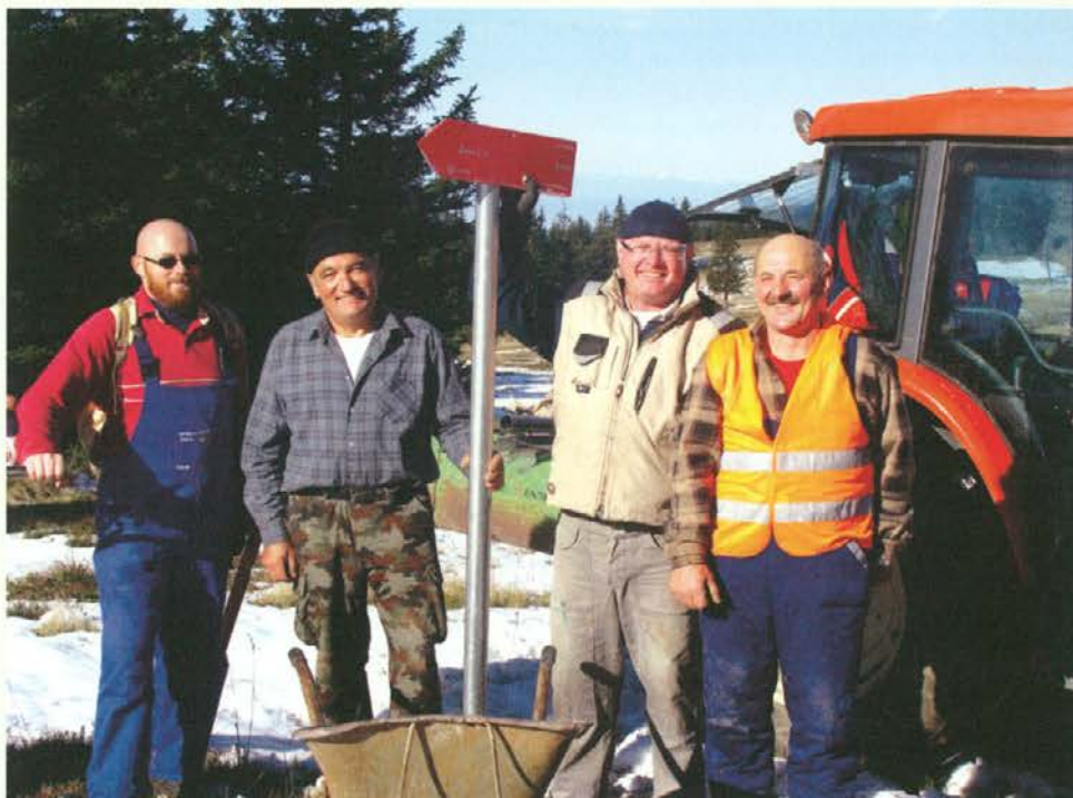
Ekipa mislinjskih markacistov na delu

Tako so v prvi fazi tega projekta pristopili k enotnemu urejanju in označevanju pohorske planinske transverzale PD Slovenj Gradec, PD