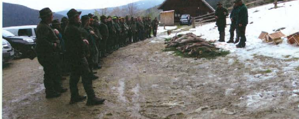
Zbor lovcev po končanem skupnem lovu na Komisiji na Pohorju

je prevladovalo od 9. oktobra dalje, razen v omenjenih treh dnevih. Več sonca je bilo v višjih predelih, saj se je v jutranjih in dopoldanskih urah pogostokrat v Mislinjski in Dravski dolini zadrževala megla. Bolj toplo je bilo v drugi tretjini meseca. Najnižje oktobrske dnevne temperature so bile na Koroškem od 2 (28., 29., 31. 10.) do 16 °C (9., 14., 17. 10.). Sončni žarki so ogreli zrak celo nad 20 °C. Najvišje dnevne temperature zraka so bile v oktobru od 7 do 25 °C (13. 10.).