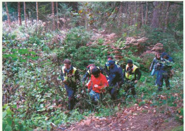
Ekipa gorskih reševalcev enote Slovenj Gradec je oskrbela ponesrečenca.