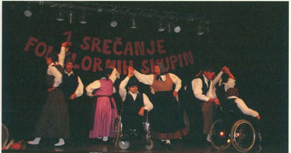
Prvi nastop VDC Muta. Nanj so se pripravljali celo leto!

Zahvaljujemo se vsem, ki s svojim prostovoljstvom, srčnostjo, znanjem in s pozitivno naravnostjo dodajate dragocen prispevek k izvedbi naših programov, s katerimi bogatimo kvaliteto življenja naših fantov in deklet – naših občanov.