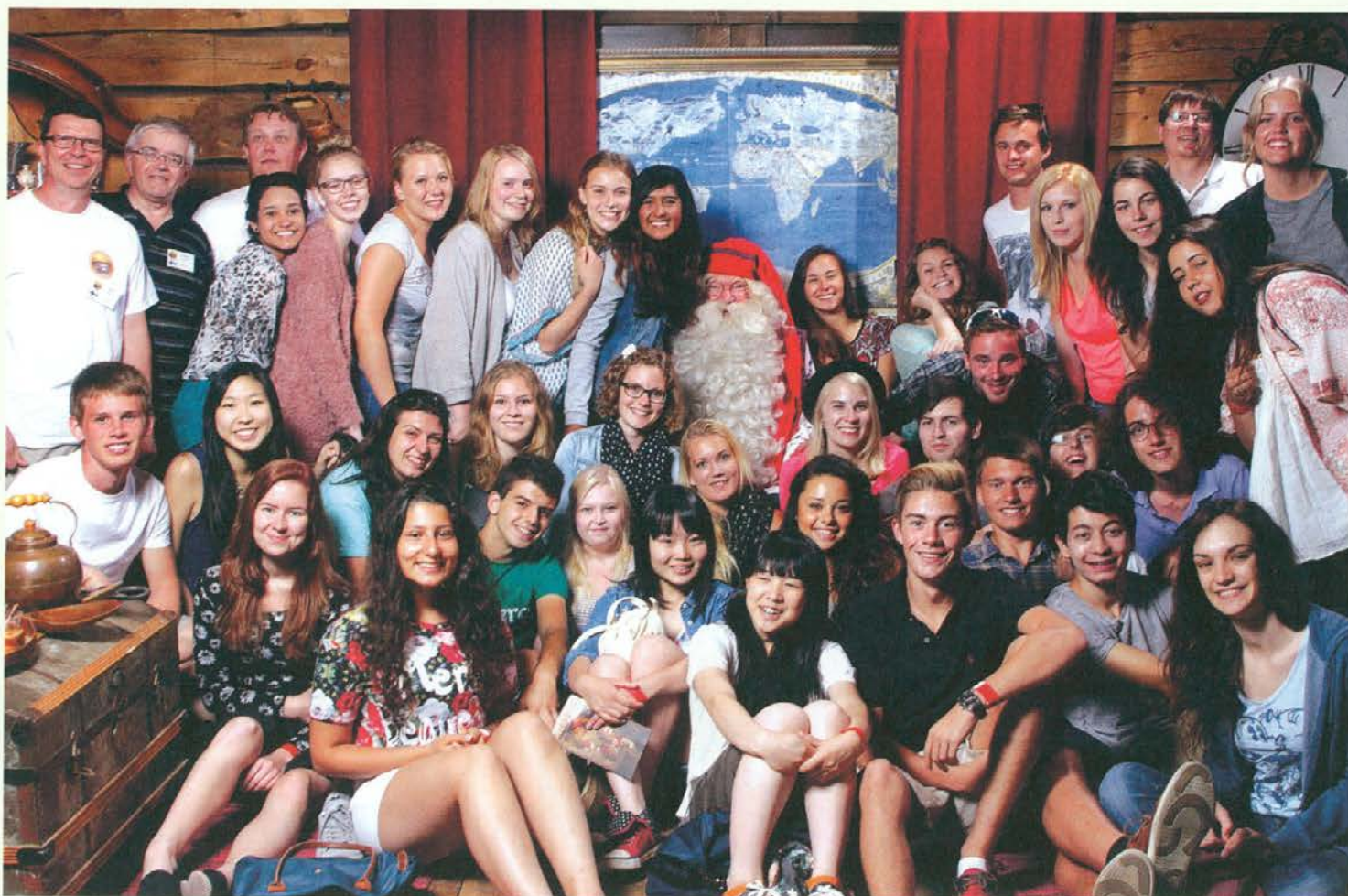
Polni nepozabnih vtisov

Med poletnimi počitnicami sem se udeležila izmenjave na Finskem. Moje potovanje se je začelo 4. 7. 014 v večernih urah, ko sem z ljubljanskega letališča letela v Helsinke. Tam me je pričakala moja prva gostiteljska družina. Skupaj smo se z avtom odpeljali do mesta Loimaa, ki je od Helsinkov oddaljen približno dve uri. Gostiteljska družina me je lepo sprejela in takoj sem se počutila kot doma. V želji, da mi pokažejo kar največ, smo vsak dan odšli