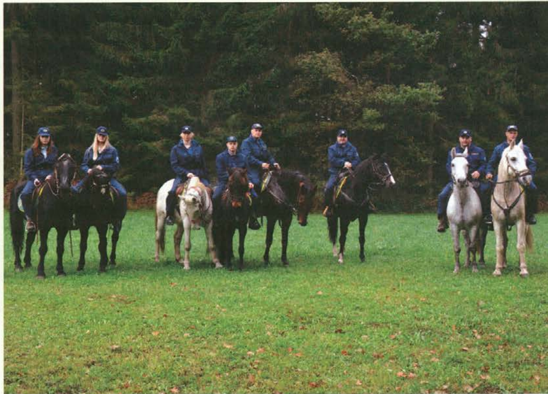
Enota CZ Cross Country Cluba Legen

Člani enote konjenikov so se zbrali ob 7.30 uri na lokaciji kluba, ostale enote pa ob 9. uri na zbornem mestu pri fitnes centru v naravi pri toplarni, kamor so