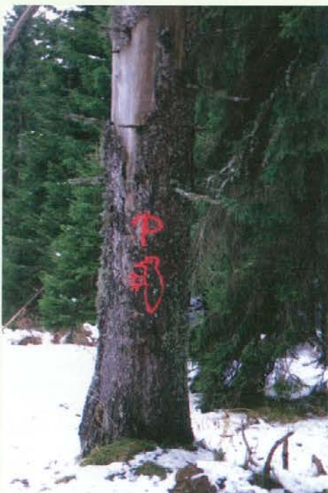
Smrekova sušica za ptiče (24. 10. 2014)

Oktober ali vinotoč je bil vendarle bolj suh kot deževen september. V koroški regiji so se v prvi polovici oktobra padavine pojavljale lokalno v obliki kratkotrajnih neviht. Močnejše padavine smo imeli v noči z 21. na 22. oktober. Po 2. uri 22. oktobra sta močne nalive spremljala tudi močnejši veter in grmenje. Zrak se je ohladil, višje je snežilo. Po 3. uri zjutraj je bila Uršlja gora že bela. Snežilo je nad 800 metri nadmorske višine. Bel je bil tudi Kremzarjev vrh na Pohorju. Višje je zapadlo 20 cm snega (Zadnji travnik na Olševi, Mulejev vrh na Mislinjskem Pohorju). Zaradi še toplih tal je sneg hitro kopnel, beli so nekaj časa ostali Kredarica in višje ležeči predeli. Nalivi pri nas 22. oktobra niso povzročili večjih težav, veter je podrl posamezna drevesa. Večje težave so imeli na območju Polhograjskega in Škofjeloškega hribovja, kjer so hudi nalivi povzročili zelo hude nevšečnosti tudi nižje ležečim predelom. Strugo so prestopili Gradaščica in drugi potoki ter poplavlili posamezne predele Ljubljane. Najhuje je bilo na Viču. Zalilo je veliko hiš, zalitih je bilo veliko avtomobilov, poplavljeni so bila tudi polja. Jasno in delno jasno vreme