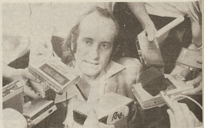
MADRID — Po 23 letih izgnanstva se je v Španijo vrnil 55-letni Antonio Cubillo, borec za neodvisnost španskih Kanarskih otokov. Po številu magnetofonov bi lahko sodili, da so njegove izjave sprejeli s precejšnjim zanimanjem.