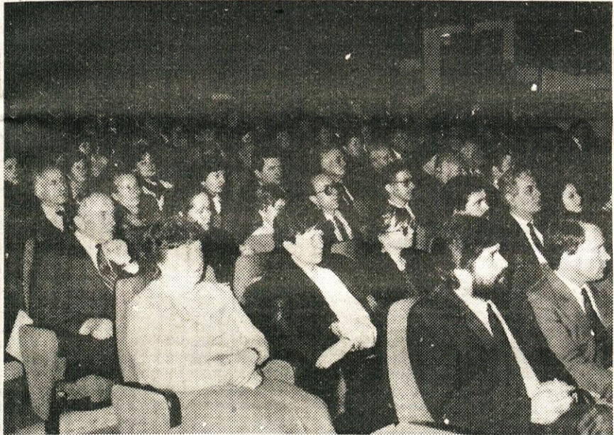
Prva predstava v novem kinu.