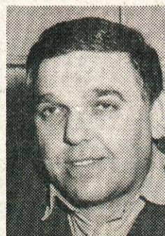
Mavracij okoren ml.