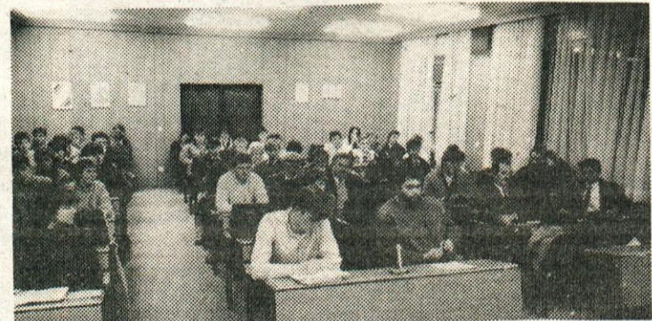
Mladi na letni programski volilni konferenci.

V tem času je aktivno deloval tudi na kulturnem, športnem in idejnopolitičnem področju. Je tudi aktivni član društva prijateljev mladine in smučarskega kluba Ihan.