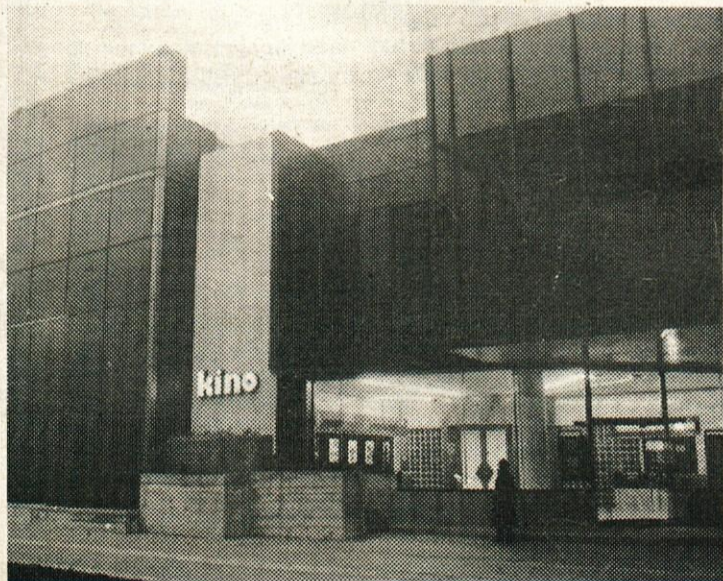
Nova pridobitev — kinodvorana