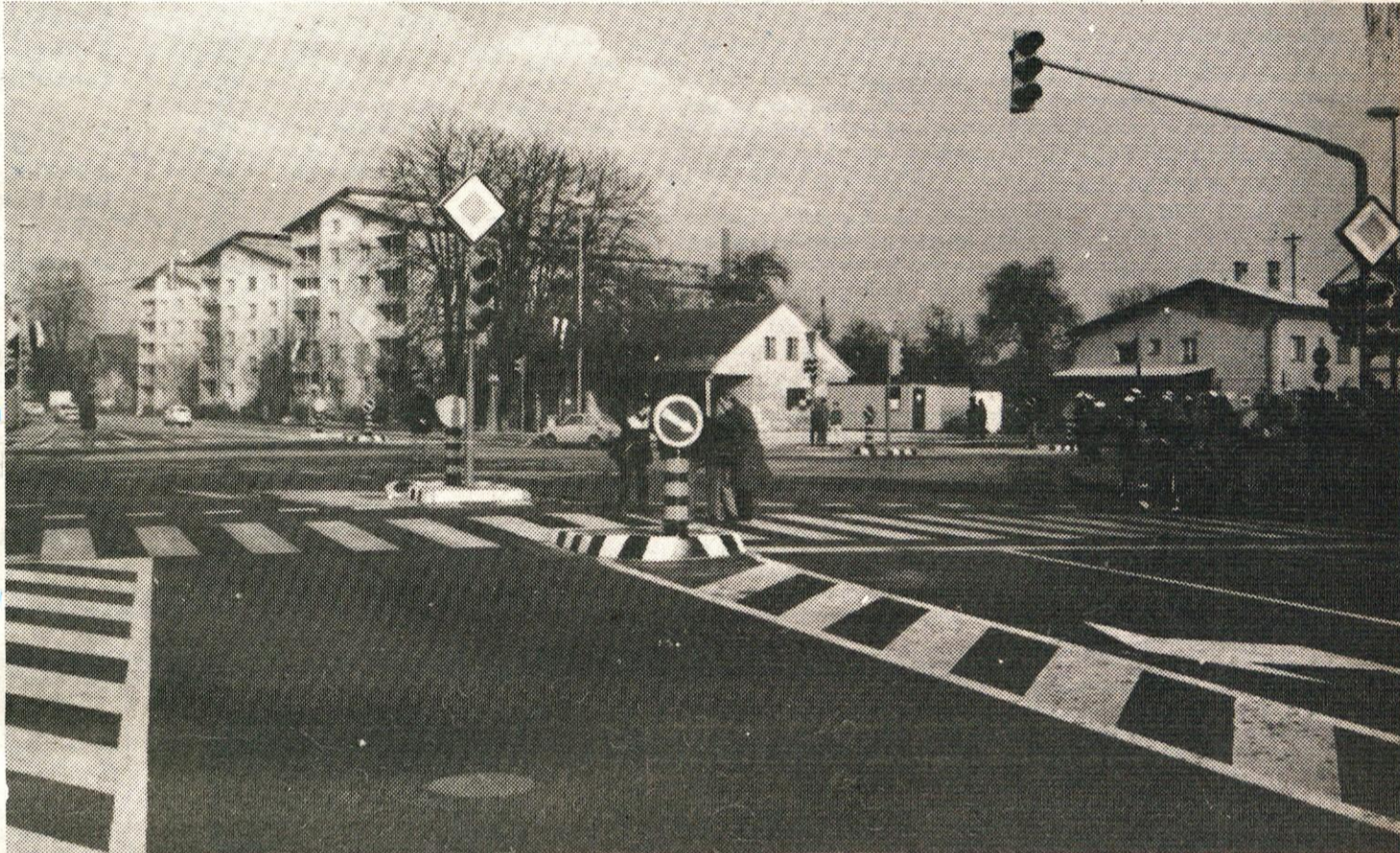
Nova velika prometna prireditev: kamniško križišče. Turkova in Slokarjeva hiša sta samo še v spominu starih Domžalčanov.

Samoupravna komunalna interesna skupnost Domžale in Občinska skupnost za ceste Domžale v zadnjih letih vse večjo težo posvečata izboljševanju prometne varnosti v naši občini. Rezultat takšne sistemske akcije je zgradnja oz. rekonstrukcija naslednjih križišč v zadnjih 5-6 letih: rekonstrukcija križišča Rodica — Preserje z avtomatskimi zapornicami na železniško-cestnih prehodih, rekonstrukcija križišča Radomlje, rekonstrukcija in semaforizacija križišča Pavovec v Mengšu, rekonstrukcija in semaforizacija križišča Rondo in Toko v Domžalah, ureditev križišča na magistralni cesti M-10 v Trzinu — poleg tega pa smo uredili pešpot v Trzinu ter pločnike in kolesarske steze na Viru ob magistralni cesti kot tudi pešpoti ob železniški progi v Domžalah. Prav tako je pomemben dosežek bil tudi pri postavitvi avtomatskih zapornic na Ljubljanski in Cankarjevi cesti v Domžalah kot tudi urejanje številnih avtobusnih postajališč oz. njihova izločitev iz vozišča. Nesporno pa sta najpomembnejši objekti in rekonstrukcija križišča Kamniške in Ljubljanske