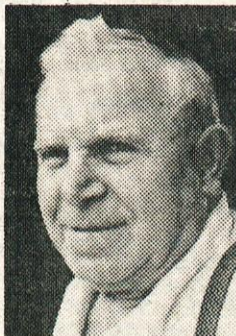
Mavracij Okoren st.