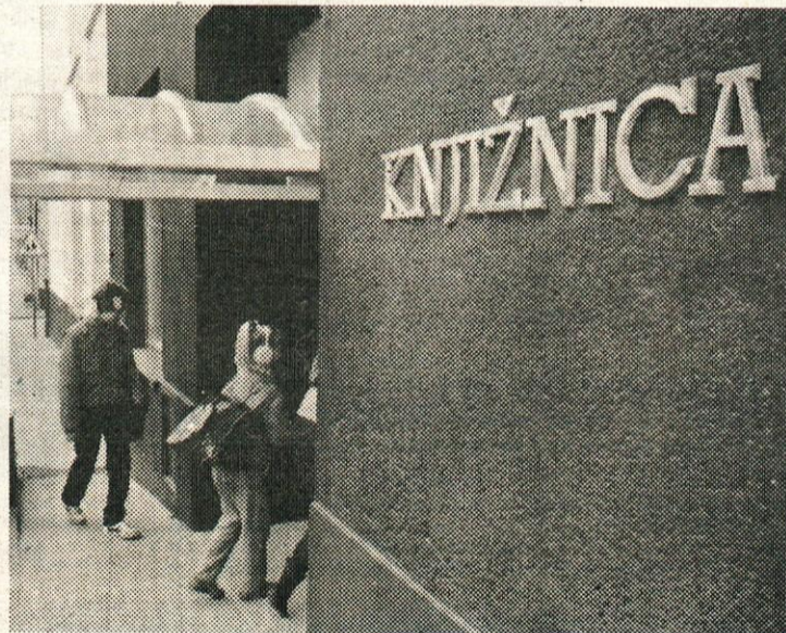
Knjižnica — kulturni center prve vrste...