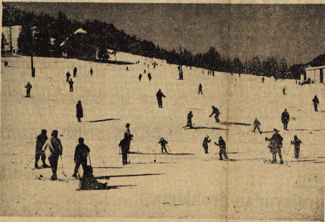
Za letošnje polletne šolske počitnice je zima kot nalašč naklonjena najmlajšim smučarjem in sankarjem. — Na sliki: zimsko veselje v Kranjski gori

Turistična direkcija na Bledu je skupaj z bivšo delavsko univerzo prirejala posebne tečaje, namenjene največ ljudem, ki bi vodili turiste po raznih krajih in jih seznanjali s kulturnimi, zgodovinskimi in drugimi turističnimi posebnostmi. Tečaji so se sicer uspešno končali in za začetek tudi dosegli svoj namen, vendar pa so zajeli vse premalo ljudi. Letos razpisuje delavska univerza Radovljica v sodelovanju z Gorenjsko turistično zvezo in turistično direkcijo Bled podoben seminar. Program seminarja zajema teme iz vseh predmetnih vrst, ki so v tesni zvezi s turizmom. Poleg kulturnih, zgodovinskih, geografskih, turističnih in organizacijskih problemov bodo obravnavali tudi gospodarstvo v občini Radovljica in zgodovino NOB, na vrsti pa bodo tudi zelo aktualne teme, kakor so: lik turističnega delavca in njegova osebnost, odnos do turistov in domačih gostov ipd. Tečaj je predviden za 36 ur ponjaka dvakrat tedensko, začeli pa bodo z njim v februarju na Bledu. — J. B.