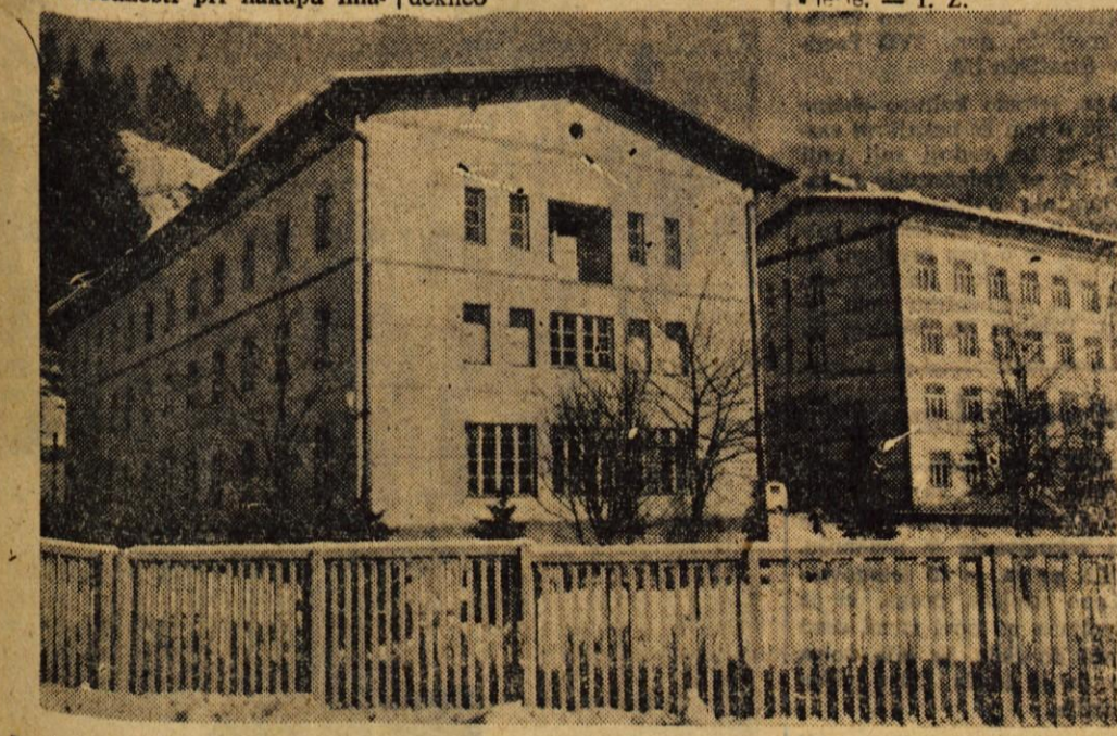
Da bi splošna bolnica na Jesenicah dobila prepotrebne nove bolniške prostore, so se odločili za preureditev dosedanjega stanovanjskega objekta v bolniški objekt. V objektu, ki ga notranje prezidavajo in preurejujejo bodo dobili prostore za otroški oddelek, za rehabilitacijo invalidov, za interno lekarno za medicinsko šolo in za upravo. Ker so dela le notranja, jih mrz ne ovira in bodo novi bolniški prostori v nekaj mesecih adaptirani.

SKOFJA LOPA — Po precej dolgem premoru so z rednim delom spet pričeli košarkarji škofješkega Partizana. S treninji so pričeli v telovadnici osnovne šole v Skofji Loki, organizirali pa so jih za člane in mladince. Za pionirje pa bodo priredili košarkarske šole. Dejavnost bodo še posebej pozdravili med semestralnimi poletnicami, saj bodo imeli telovadnico vsak dan na razpolago. — A. P.