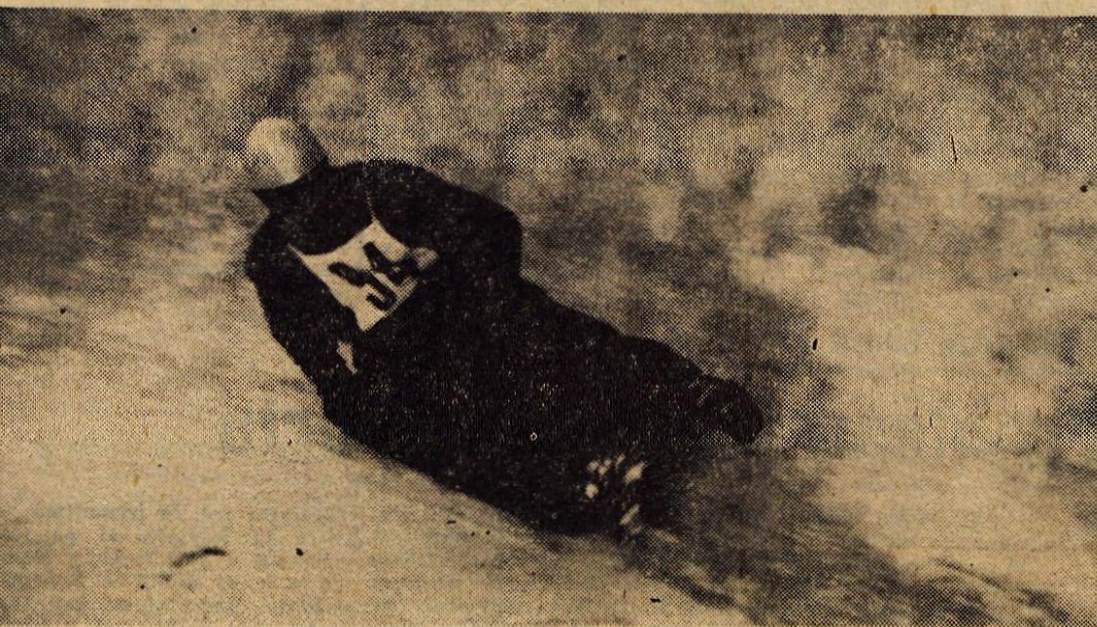
Razen naših najboljših sankacev, ki so trenutno na svetovnem prvenstvu v Zahodni Nemčiji, so večeraj vsi gorenjski predstavniki te panoge tekmovali za pokal Kranja na Smarjetni gori.