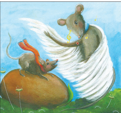
Ilustracija: Mojca Sekulič Fo

naredili velikega sneženega moža in mu dali klobuk na glavo in šal okrog vratu, da mu ne bi bilo mraz ... Z rdečimi lički in iskričami očmi je otroke, ki se zabavajo na snegu, ilustrirala Živa Pahor. Segavi utrinki pod snegom sestavljajo tudi strip Ko-Ko-Krišna , ki ga ustvarjata Maša Ogrizek in Miha Ha. V tople poletne dni ob morju pa se bralec vrača ob branju zgodbe v stripu Počitniški biser Sandre Kump Crasnich, in ob stihih pesmi Čoln Jureta Jakoba; ilustracija s krepkimi zamahi čopiča je delo Anje Jerčič Jakob. V skrivnostni svet sanj, kjer bivajo čudna bitja s