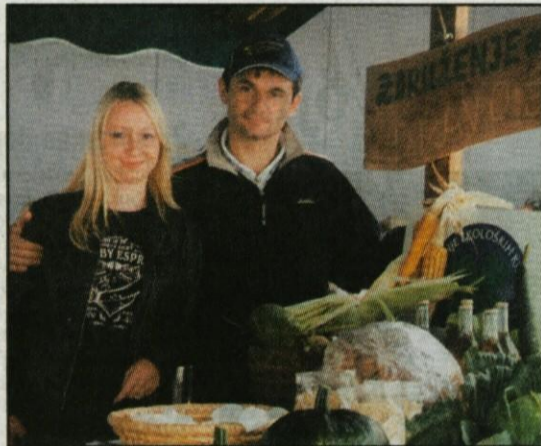
Tudi letos so se na sejmarjenju predstavljala tri društva s področja kmetijstva: Ajda, Združenje ekoloških kmetov »Zdravo življenje«, ki je imelo stojnico skupaj s Turistično rekreativnim društvom Konfin Sv. Trojica (na fotografiji) ter Društvo podeželskih žena Domžale. Dobro obiskana pa je bila tudi stojnica Čebelarstva društva Domžale.