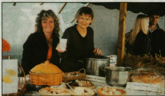
Že lani je Turistično društvo Ihan pripravilo pokušino jedi, na katere smo že vsi pozabili. Ajdova kaša s suhimi slivami in kašnato zelje sta bili ob domačem kruhu in zaseki prava paša za oči in usta.