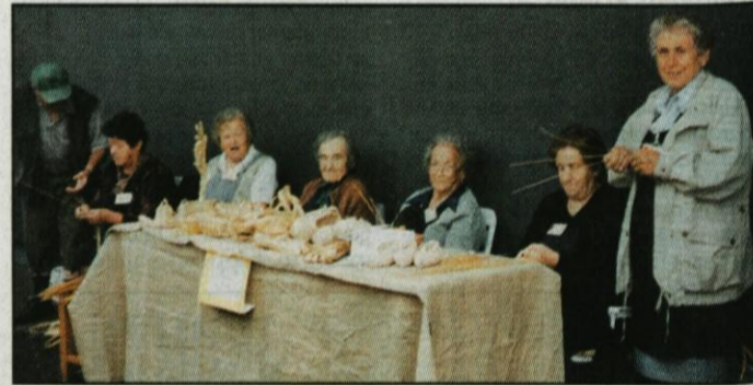
Med gosti omenimo Turistično društvo Moravče ter članice Kulturnega društva Franc Maselj Podlimbarski iz Krašnje.