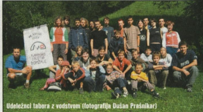
Udeleženci tabora z vodstvom