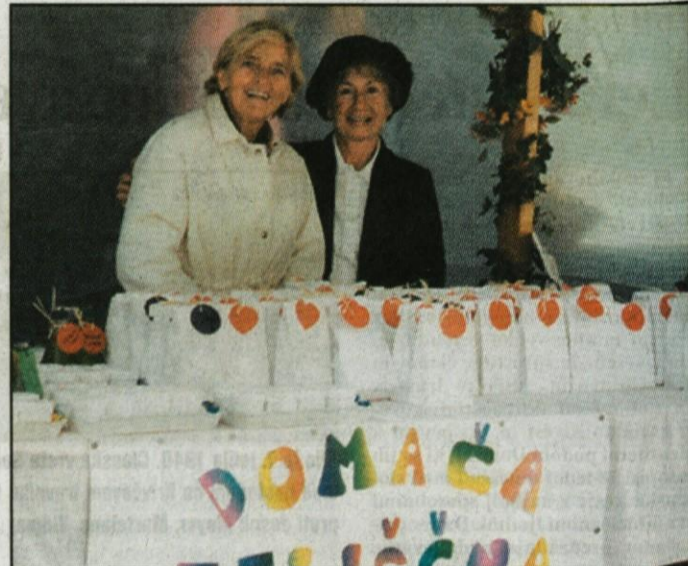
Med društvi s področja turizma je izstopalo Turistično društvo Jarše-Rodica s ponudbo zdravnih zelišč in čajev ter drugih izdelkov.