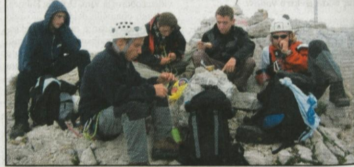
Na vrhu Ojstrice.