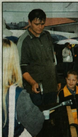
Zabljanje žeblja v dobrodelne namene.