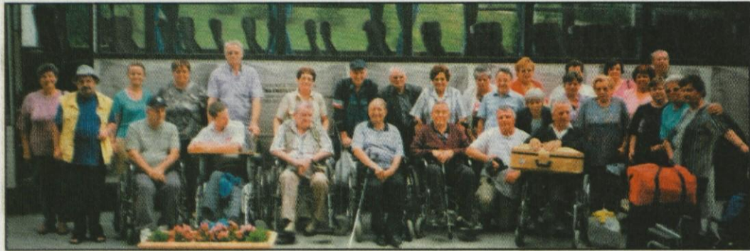
Medobčinsko društvo invalidov Domžale