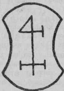
2. Pečat Jurija Chus iz Bele, 1590.