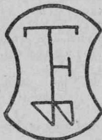
1. Pečat Štefana Biline iz Bele, 1603.