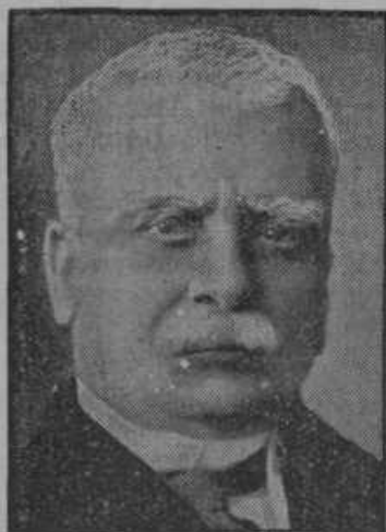
Aleksander Zaimis. Na Dunaju je umrl 79letni Zaimis, zadnji predsednik grške republike.

Dogodki v Španiji dajejo Evropi še nek drug dragocen nauk, ki bo lahko prinesel dragocene sadove. To je resnica, ki je zdaj postala vsem jasna, tudi tistim, ki so prej bili udarjeni s slepoto. In ta resnica je: edina prava ovira boljševiškega nauka in dela je krščanski nauk ter krščansko življenje, kakor ga uči in zahteva katoliška cerkev. Kdor se proti katoliški cerkvi in veri bori in se trudi, da bi preprečil njene blagodejne učinke na posameznika, na družino, na narod in na državo, ta se nehote pridružuje prevratnim silam boljševizma z istim žalostnim uspehom za človeško družbo in za lasten narod. Boljševizem je mogel doseči svoje uspehe le, ker mu je pripravil tla oni liberalizem, ki je ločil med katoliško vero in političnim udejstvom, hoteč vero izpremeniti v golo nabožništvo, ne da bi ji pustil svobodo, da se izdejstvuje po svoji zveličavni morali in njeni posvečujoči sili tudi v družabnem organizmu družine, občine, države, naroda in tako dalje. Kdor stavlja ovire polnemu razvitku krščanske vere v dejanskem življenju ljudstva, ta pospešuje in odpira pot vplivu in delovanju prevratnih sil sodobnosti.