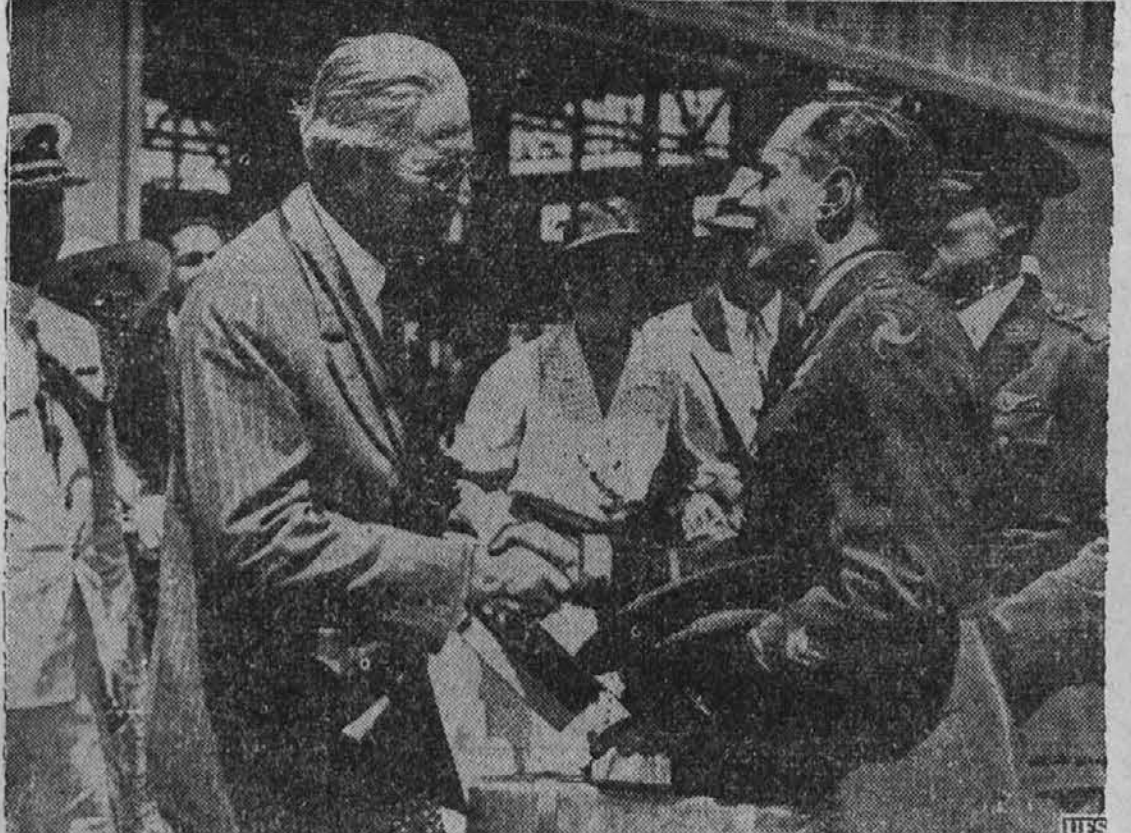
Države južne Amerike so navdušeno pozdravljale šest vojaških letalcev Zed. držav, ki so nedavno napravili 12,000 milj dolgi polet, da prisostvujejo inauguraciji argentinskega predsednika Ortiza. Slika kaže, ko ameriški poslanik čestita poveljniku teh letalcev.