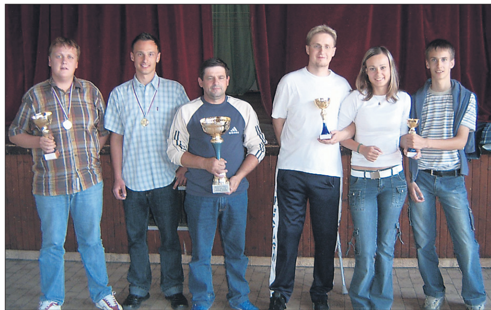
Prejemniki pokalov na turnirju