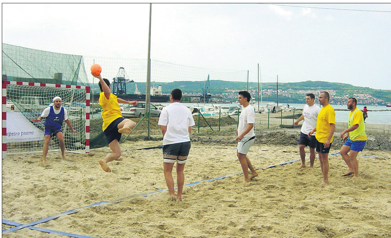
Rokomet na mivki počasi pridobiva svojo veljavo

Igrišče mora biti na najmanj 30-40 cm globokem pesku oz. mivki. Okrog mora