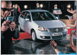
Pomirjujoče varen. Vznemirljivo lep. Novi Polo.