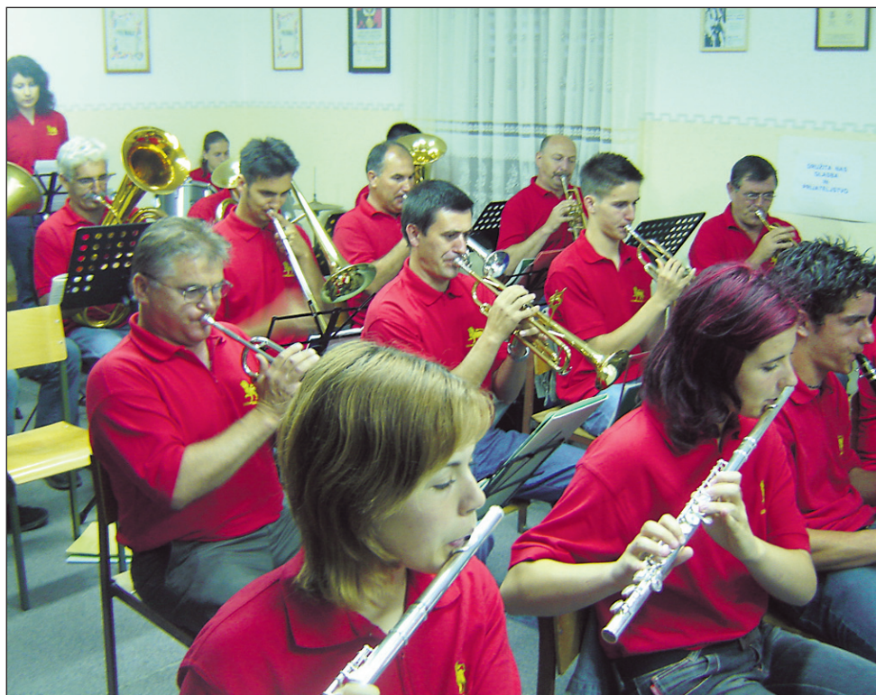
Otvoritveni koncert v obnovljenih prostorih