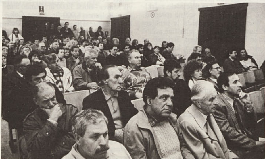
V petek, 31.3. so na shodu v Bazovici Slovenci in naravovarstveniki vnovič obsodili samovoljno oblastniško razmetavanje kraškega prostora pri izbiri lokacije za tržaški sinhrotron.