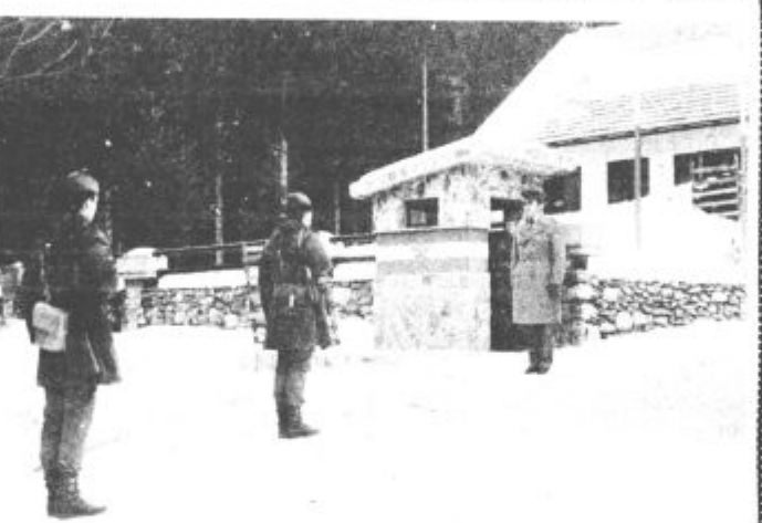
NAŠE MEJE SO VARNE — Vojaki, ki varujejo nedotakljivost naših meja, svojo nalogo opravljajo vestno in odgovorno, ne glede na vremenske razmere, ne glede na kakršnekoli nevarnosti. Sonce, dež, veter, megla, sneg in mraz so njihovi stalni spremljevalci, ki pa ne vplivajo na opravljanje zahtevnih, napornih in odgovornih dolžnosti. To seveda velja tudi za vojake v obmejni postojanki »Savinjski partizan« v Logarski dolini, ki morajo pozimi v strmih pobočjih Matkovega kota svoje napore vsaj podvojiti. Omahovanja seveda ne poznajo in naša meja s sosednjo Avstrijo ni zato nič manj varna.