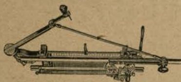
Najboljši švicarski pletilni stroji DUBIED