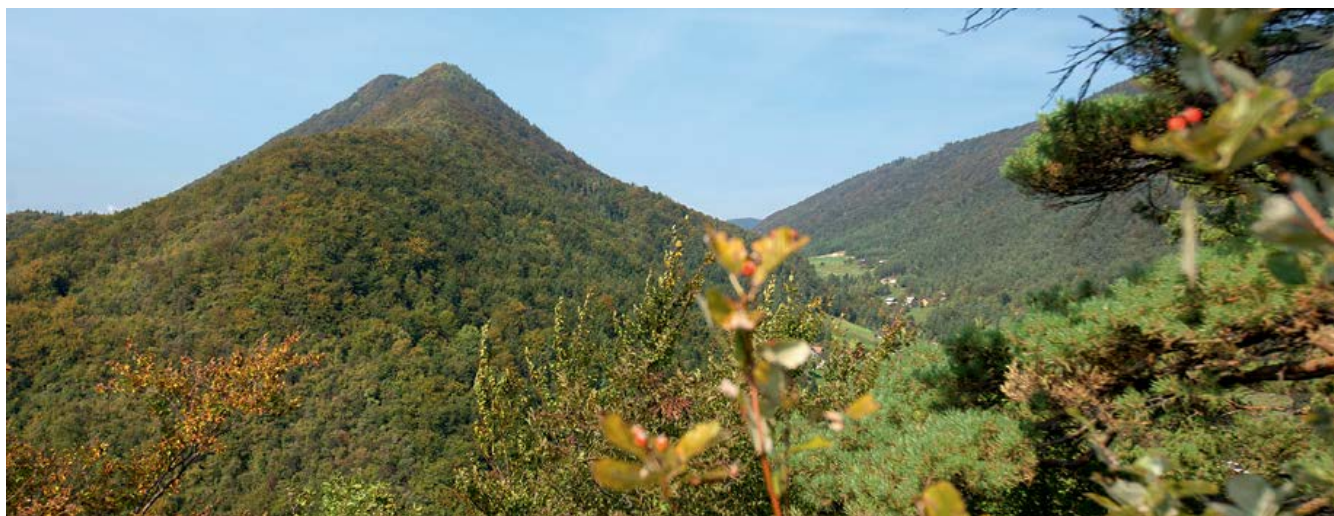
Pogled na Kislico z Lindeškega gradu

Kislica, ki ji manjka le 6 m, da bi jo uvrstili med tisočake, je pri slovenskih planincih, razen pri domačinih, malo poznana. Z vrha ni pravega razgleda, krasen razgled na Celjsko kotlino pa se nam ponudi, če z