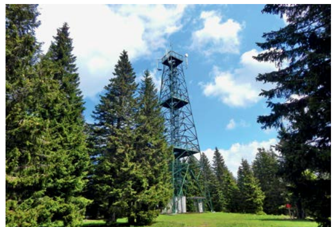
Razgledni stolp na Rogli

Z avtoceste Ljubljana–Maribor zapeljemo lahko na izvoz za Celje oz. severno za Vojnik ali pa za Slovenske Konjice. V obeh primerih peljemo proti naselju Stranice, kjer zapeljemo na zahod proti izhodišču. Parkiramo v centru Vitanja pri Kulturnem središču evropskih vesoljskih tehnologij (KSEVT). WGS84: N 46,381172°, E 15,293985° Koče: Planinskih koč ni, so pa hoteli na Rogli.