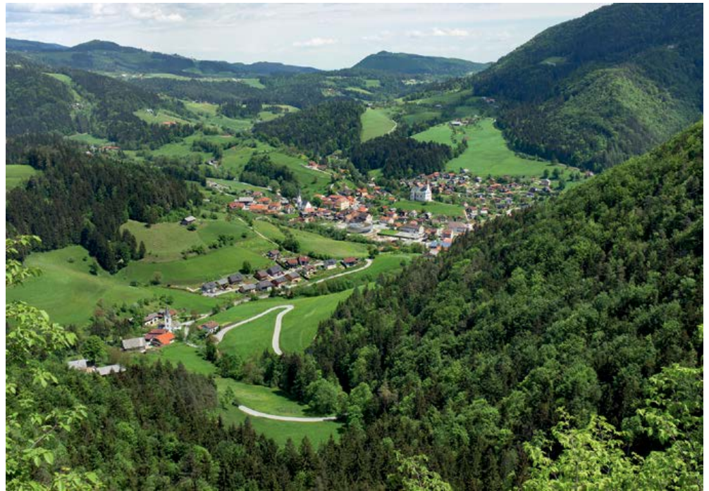
Vitanje s Stenico na desni zadaj

Oprema: Običajna planinska oprema. Višinska razlika: Pribl. 660 m