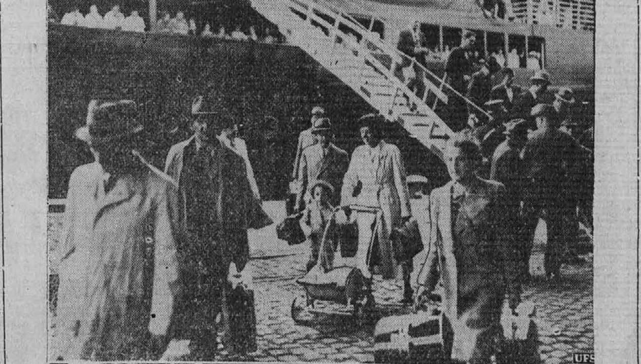
Skozi cela dva meseca je morala skupina Judov begati sem in tja preko Atlantika, ko se je vsaka država upirala, da bi jih sprejela. Končno so našli zatočišče v Belgiji in gornja slika kaže, ko se je ena njih skupina izkrcala v Antverpnu.