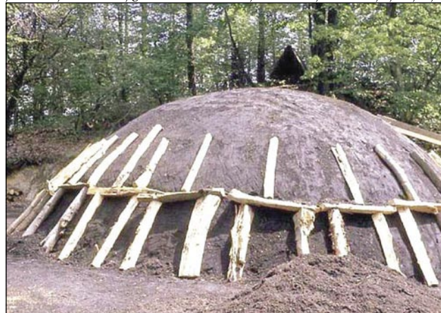
Tak so redili vaugeldje na Pohorji

više Ljubljane, gnauk pa v bosanskom Sarajevoni tó. Grajnca Pohorja je na söveri reka Drava, na pravom bregaj štere so leta 1863 zozidali železnico med Mariborom pa Celovcom (Klagenfurtom). Te so začnili na nikoj priti lidgé, šteri so po reki s čunami blago pelali. Ovak so na Dravi prvo hidroelektrarno (vizi-erómü) zozidali že leta 1918 na Fali, te je bila ta največša v cejloj srednjaj