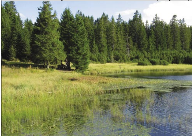
Na pohorskom barji dosta mali jezer geste

Lüstvo v dolinaj je do nej davnik gledalo na pogorje (hegység) Pohorje kak na krajino, v štero je nej mogauče priti pa v šteraj lesaj živejo samo divdije stvarine pa čalarice. V eto krajino Vas zavóemo, ka bi pokazali, ka