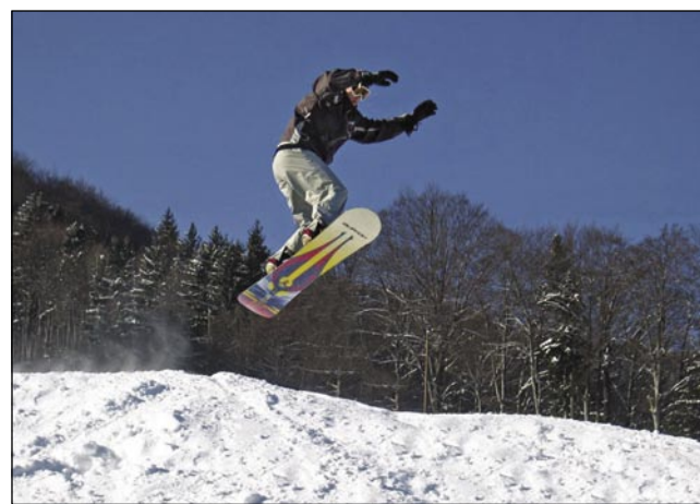
Pohorje je paradíž za zimske športnike

Zatok je meštirja vómrla - zvün tistoga, gda za piknike valon vaugeldje redijo. V indašnji cajtaj so kovači nūcali takzvane »repače«, šteri so bili veuki