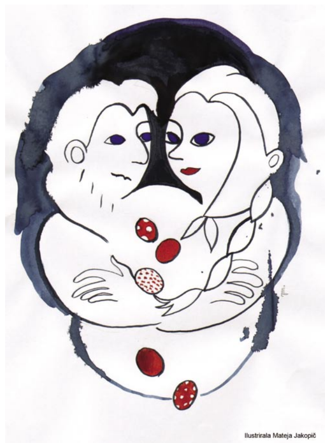
ilustrirala Mateja Jakopič

Pejpi pa nikaj: tüj pa tam je samo polüknno skouz okno, pa tüdi pokloncko po glažojni, gda pa je vertinja od čemerov zdignila pesnico, pa ga je že sfalilo.