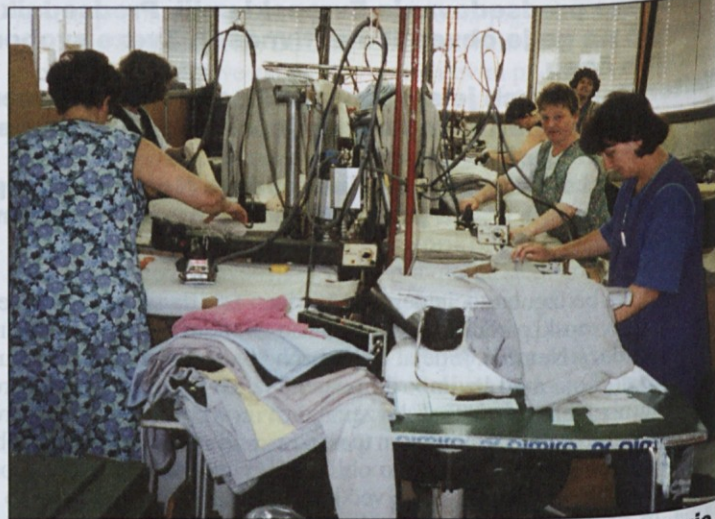
Delo v likalnici zanesljivo ne vpliva ugodno na zdravje delavk.