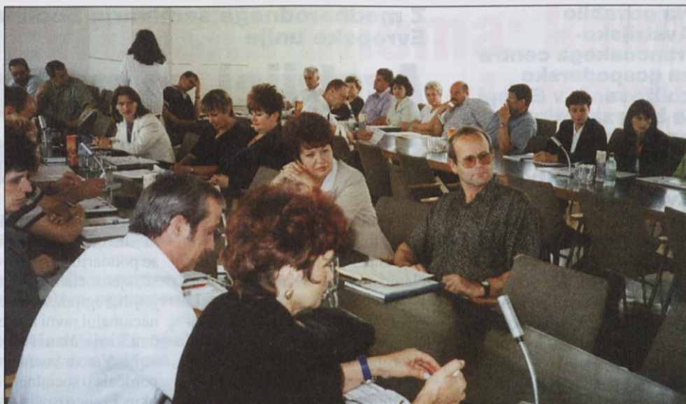
Člani republiškega odbora sindikata delavcev tekstilne in usnjarskopredelovalne industrije so z zanimanjem poslušali šefe evropskega sindikata.