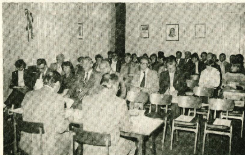
Kulturna skupnost in Zveza kulturnih organizacij imata veliko zasluge za velik razmah kulturne dejavnosti v občini. K temu pa veliko pripomorejo tudi na zasedanjih skupščine sprejeti sklepi

Ko danes ocenjujemo mrežo društev ZKO v domžalski občini, lahko ugotovimo, da svojo dejavnost razvijajo na območju vse občine. Med posameznimi dejavnostmi se je daleč najbolj razmahnila glasbena dejavnost na vokalnem in instrumentalnem področju