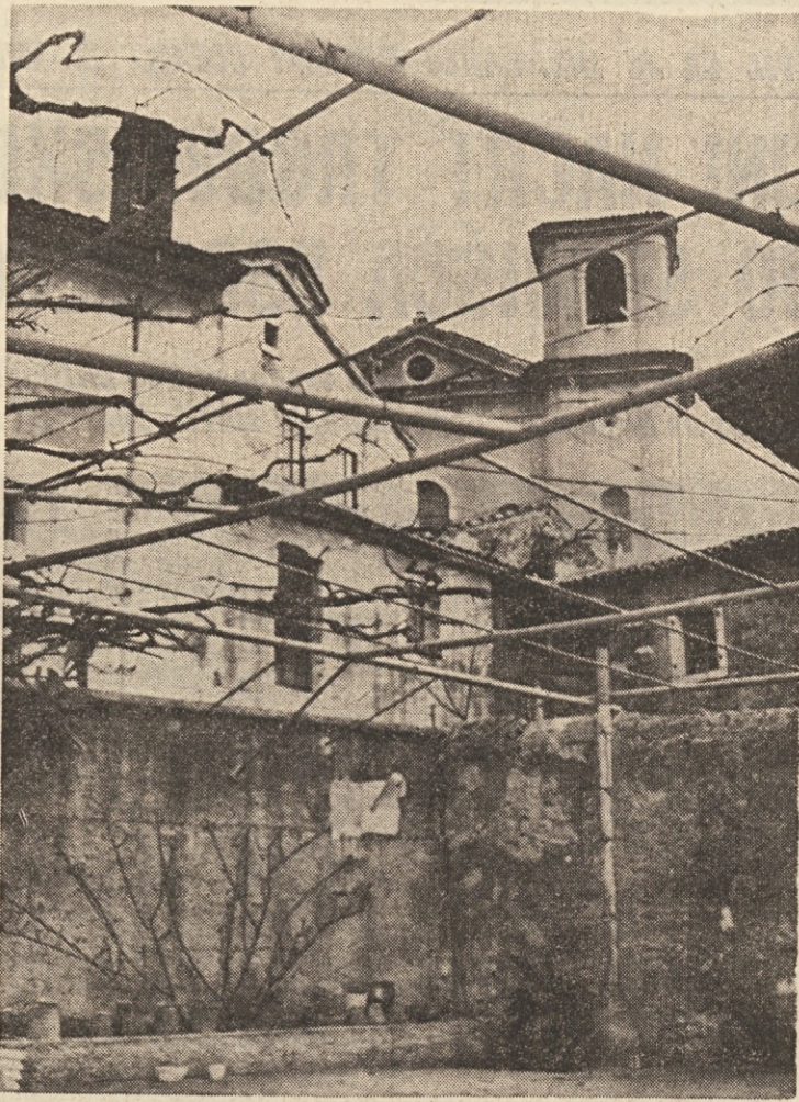
Zimski motiv iz Riemana

Morda obstajajo med velikima vietnamskima prijateljema kaka vzajemna sumničnja glede njunega vpliva in položaja v Hanoju, kot tudi medsebojno tekmovanje z zvezi s tem. Ker ni mogoče, razumljivo, v odstotkih izračunati oziroma ugotoviti, koliko sta za DR Vietnam pomenila neposredno kitajsko zaledje, tista dolga meja s Kitajsko, in pa večna negotovost ZDA v zvezi z morebitno neposredno intervencijo Kitajske. Te ga, seveda, Maocetung ni omenil.