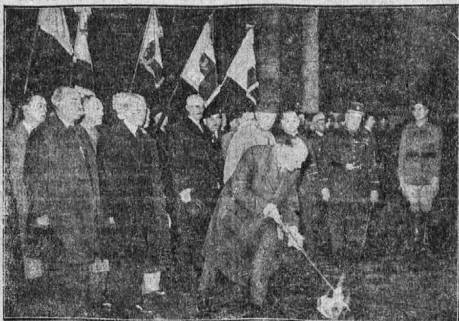
Pred grobom neznanega vojaka v Parizu

□ Štirje sovjetski rušilci so vrgli dne 11. t. m. sidro v Port Saidu in prvič po svetovni vojni so mornarji odšli na kopno ter se sprehajali po mestu, čeprav med Rusijo in Egiptom ni nikakršnih onosov. Omenjene ruske ladje bodo nadaljevale pot skozi Rdeče morje na Daljni vzhod, da tam okrepijo ruske pomorske sile.