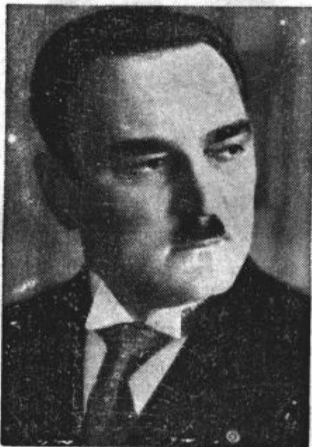
Dr. Milan Stojadinović

Bonnetova naloga je težavna in ni dosti upanja v uspeh. On je glavni nasprotnik devizne kontrole, ki jo zahtevajo socialisti in komunisti. Socialisti tudi zahtevajo obnovitev vlade ljudske fronte pod njihovim vodstvom. Zato smatrajo v parlamentarnih krogih, da se Bonnetu nikakor ne bo posrečila sestava nove vlade.