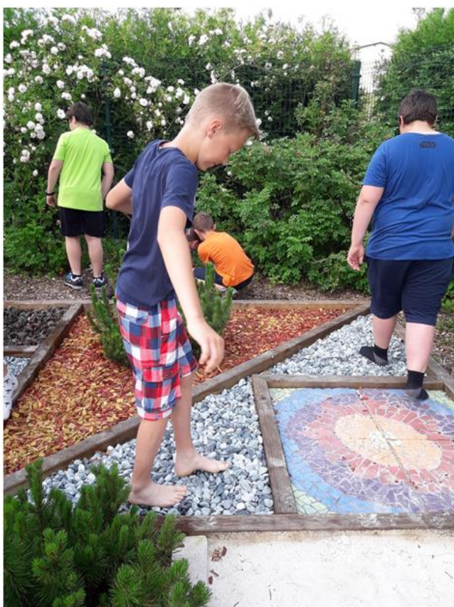
Čutna pot na šolskem ekovrtu.

Sodelovali bomo na natečaju Planetu Zemlja prijazna šola, katerega cilj je razumevanje in razvijanje sonaravnega bivanja in delovanja v vseh porah življenja.