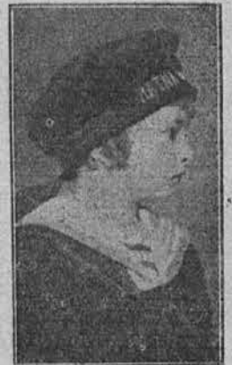
Kralj Peter II

trobojnice. Posebno pa pomoli stare luke so bili razkošno okrašeni.