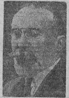
Umorjeni francoski zunanji minister Barthou