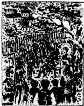
Vidmaric kaže kmetom moč „Pakraških kapljic“ in „Slavonske zeli.“

JURIŠIČ, lekarnar v Pakracu št. 209, Slavonija. — Denar se pošilja naprej ali s poštnim povzetjem.