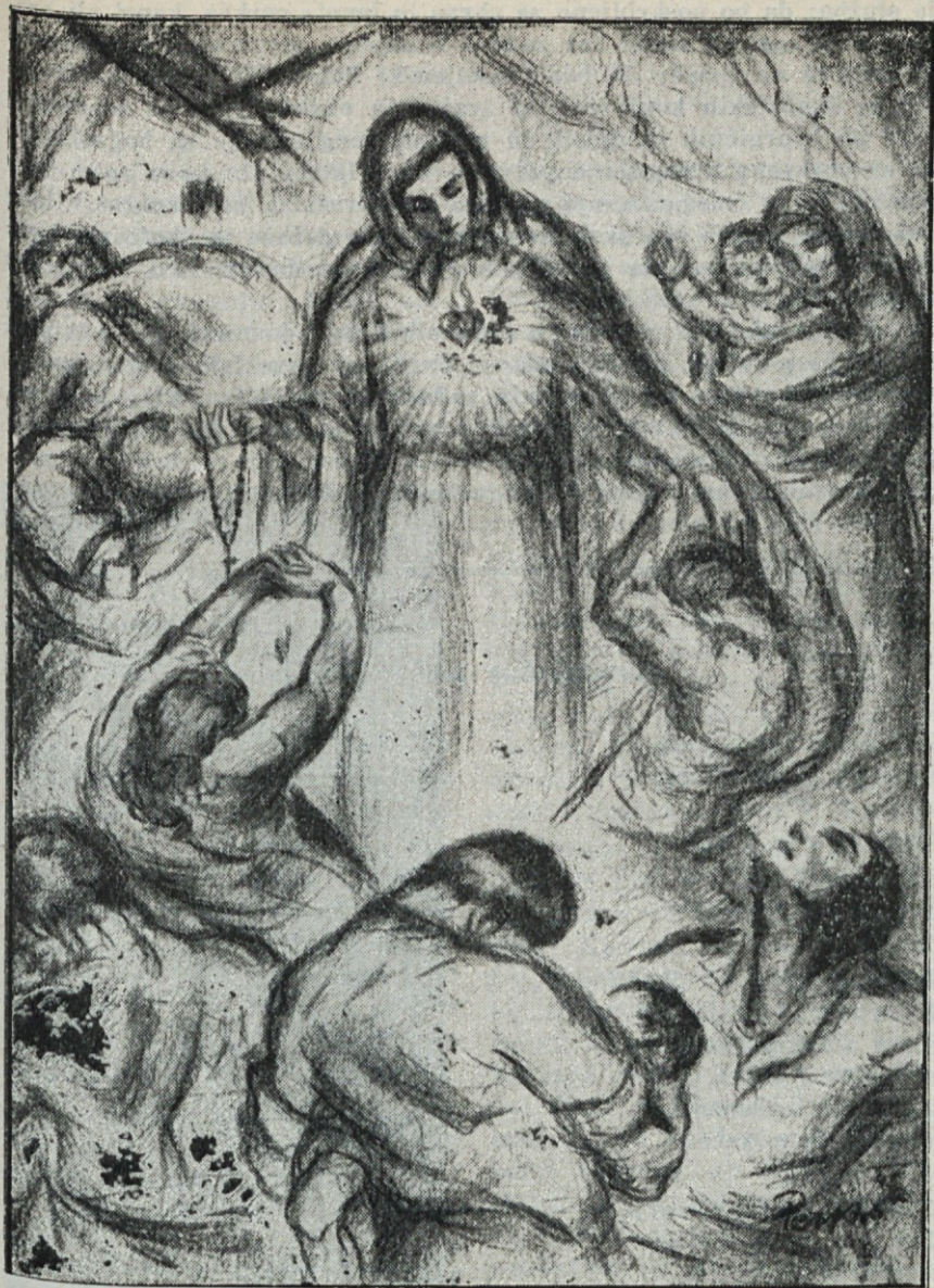
Prinčica kraljstvih in pomočnica kristjanov (Lojze Perko)