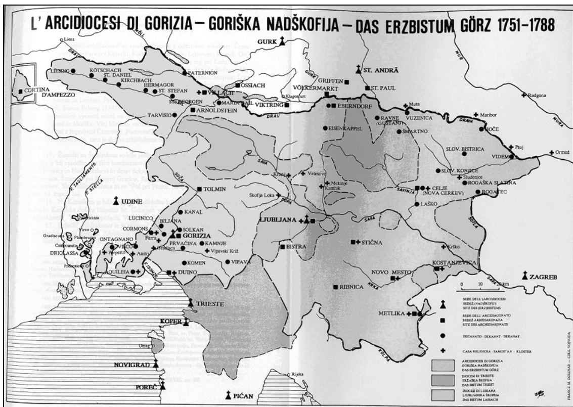
Zemljevid goriške nadškofije. 16

Dunaj se je seveda čutil dovolj močnega, da nadaljuje začeto ofenzivo, zato je od papeža zahteval dokončno ukinitvev patriarhata in ustanovitev dveh škofij v enakem rangu (škofija, nadškofija, patriarhat) v Gorici in Vidmu. Benetke so nasprotno vztrajale pri premestitvi sedeža patriarhata v Videm. V spor se je na prošnjo Benetk vmešala še Francija, a brez uspeha. 17 Benetke so se uklonile šele takrat, ko so prišle do spoznanja, da so politično popolnoma kapitulirale, hkrati pa so bile podvržene še zunanjemu, mednarodnemu pritisku. Zato so januarja 1751 ponovno vzpostavile diplomatske odnose z Rimom. Popustil je seveda tudi Dunaj. Eksplisitno so poudarili, da se dokončno odpovedujejo zahtevi, da bi goriški škof dobil naslov patriarha, odpovedali pa so se tudi prenosu sedeža patriarhata iz Ogleja v Gorico.