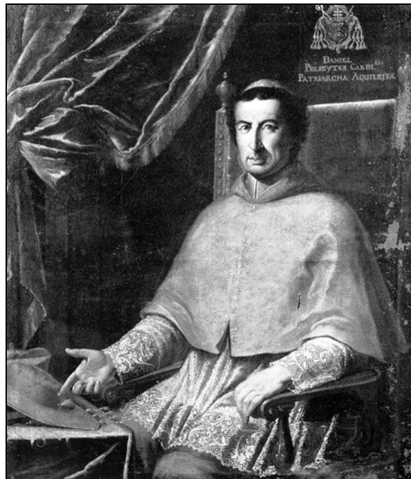
Danijel Delfin (Daniele Delfino), oglejski patriarh (21. V. 1734–6. VII. 1751), videmski nadškof (6. VII. 1751 – † 13. III. 1762). 18