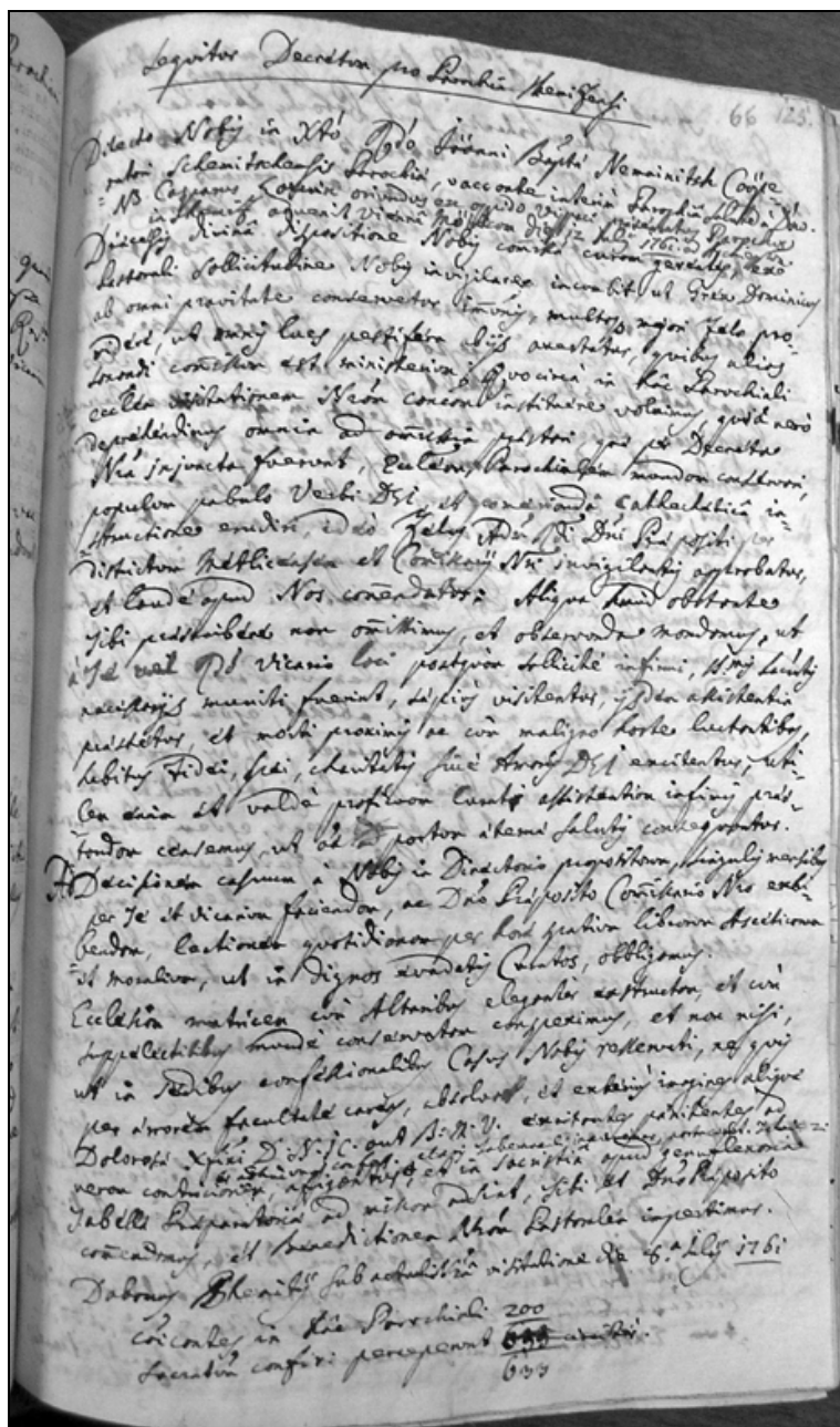
Vizitacijski dekret za župnijo Semič iz leta 1761. 63

obhajilo. Slednje je v velikonočnem času prejelo 2.300 vernikov. Spovedi se ni udeležilo 800 faranov. V letu dni sta bila v zakonu rojena 102 otroka in en nezakonski. Babice so bile izprašane. Vsi otroci so bili krščeni. Zakoni so se vedno sklepali po veljavnih pravilih. V letu dni je zakonsko zvezo sklenilo 30 parov. Noben zakon ni bil sumljiv, nihče od zakoncev tudi ni živel ločeno. Bolniki so se previdevali zastonj. Denar so jemali zgolj v primeru,