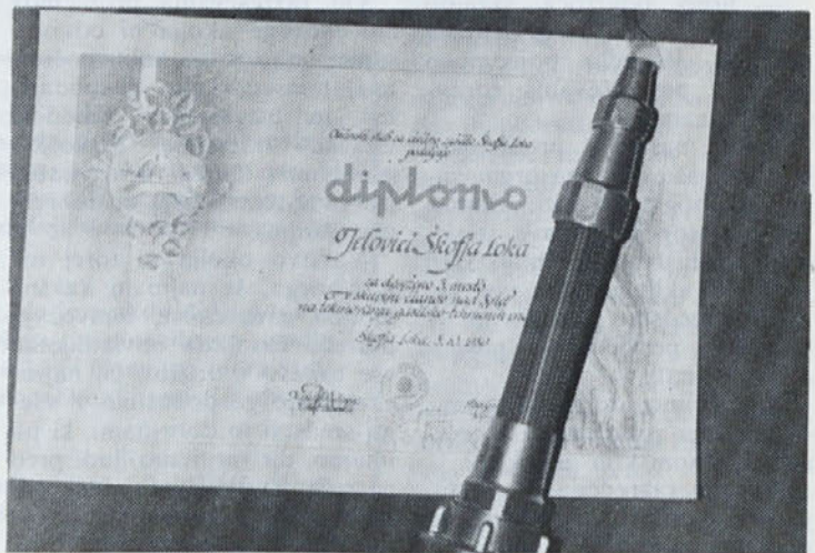
Diploma za osvojeno tretje mesto in praktično darilo — trofeja ekipe