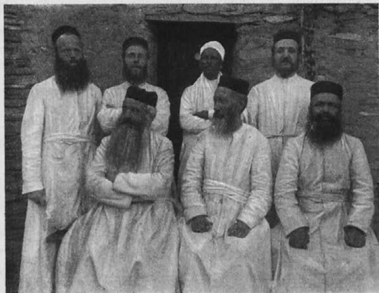
Lazaristi v Alitieni (Abesinija).