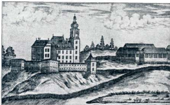
GRAD BRANEK L. 1681.

št. 10. (5. marca 1849) „Pravega Slovenca“, ki javlja, da so na Štajerskem pri opetovanih volitvah brez ovir volili za Frankobrod, samo v Ptujju še ne. „Dunajske Novice“, ki poročajo o tej zadevi 25. februarja 1849 pišejo; „Ako bi Slovencev že ne nosili tako