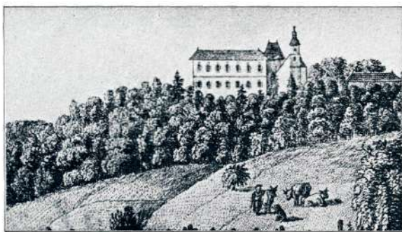
GRAD BRANEK L. 1825.